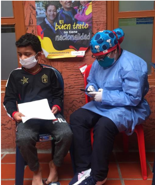
Tamizaje de sintomáticos respiratorios Ipiales, Nariño.

• Apoyo a las secretarías de salud departamentales, distritales y/o municipales y hospitales públicos locales, en la recolección y diligenciamiento de datos en plataformas y sistemas de información, depuración de información y elaboración de informes, infografías y boletines epidemiológicos para el análisis de la situación de salud en el marco de la pandemia.