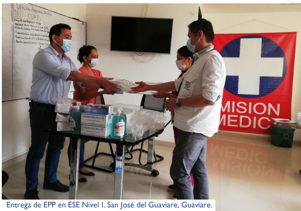
Entrega de EPP en ESE Nivel I. San José del Guaviare, Guaviare.

La OIM, a través de su Programa de Migración y Salud (M&S), activó un equipo nacional de gestión de crisis, provocado por la COVID-19 y 13 equipos territoriales interdisciplinarios conformados por 52 profesionales expertos en salud pública, epidemiología, enfermería, psicología, trabajo social, sistemas de información, además de 58 gestores comunitarios en salud que brindan apoyo a las autoridades territoriales de salud y hospitales locales para la atención a la población migrante y comunidades de acogida. Adicionalmente, el programa activó un equipo de 26 profesionales de enfermería que apoyan la respuesta, en igual número de comunidades rurales dispersas del país, incluyendo los ETCR.