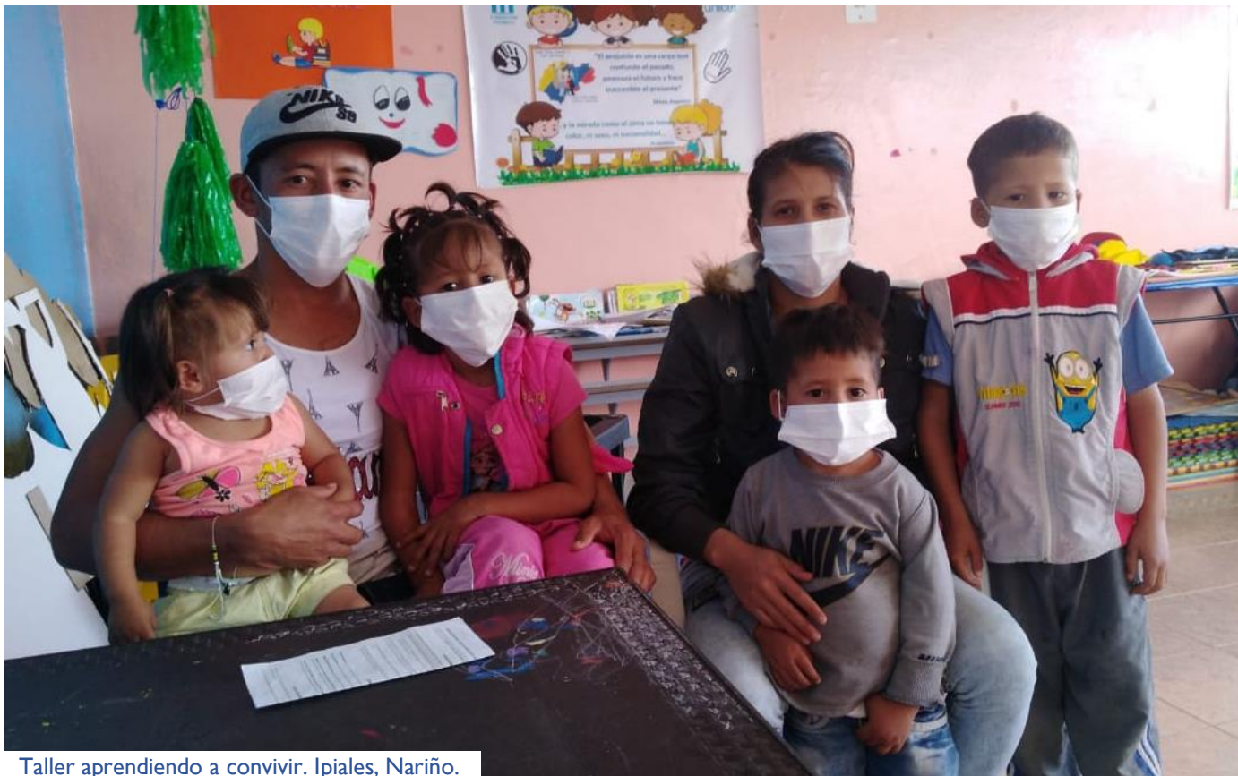
Taller aprendiendo a convivir. Ipiales, Nariño.