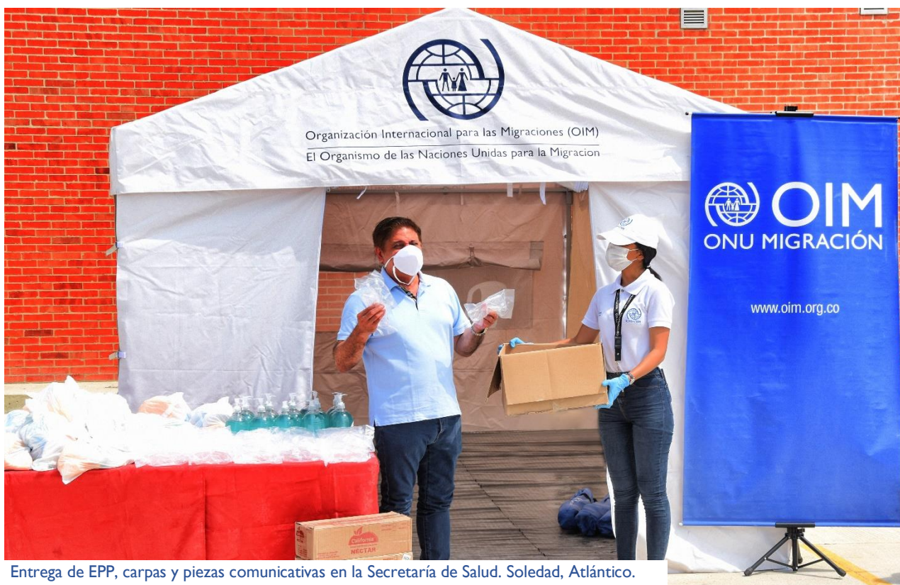
Entrega de EPP, carpas y piezas comunicativas en la Secretaría de Salud. Soledad, Atlántico.