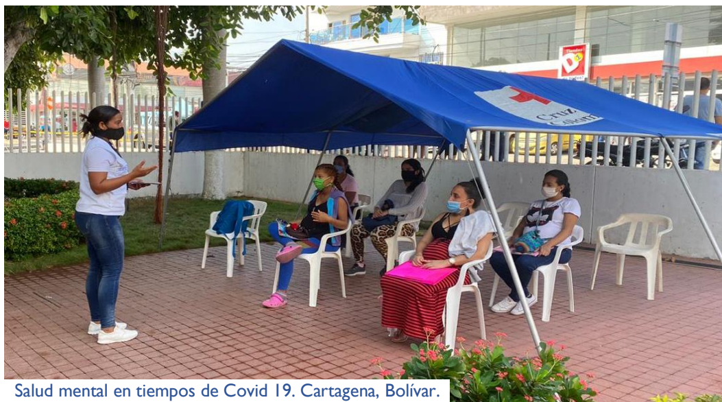
Salud mental en tiempos de Covid 19. Cartagena, Bolívar.