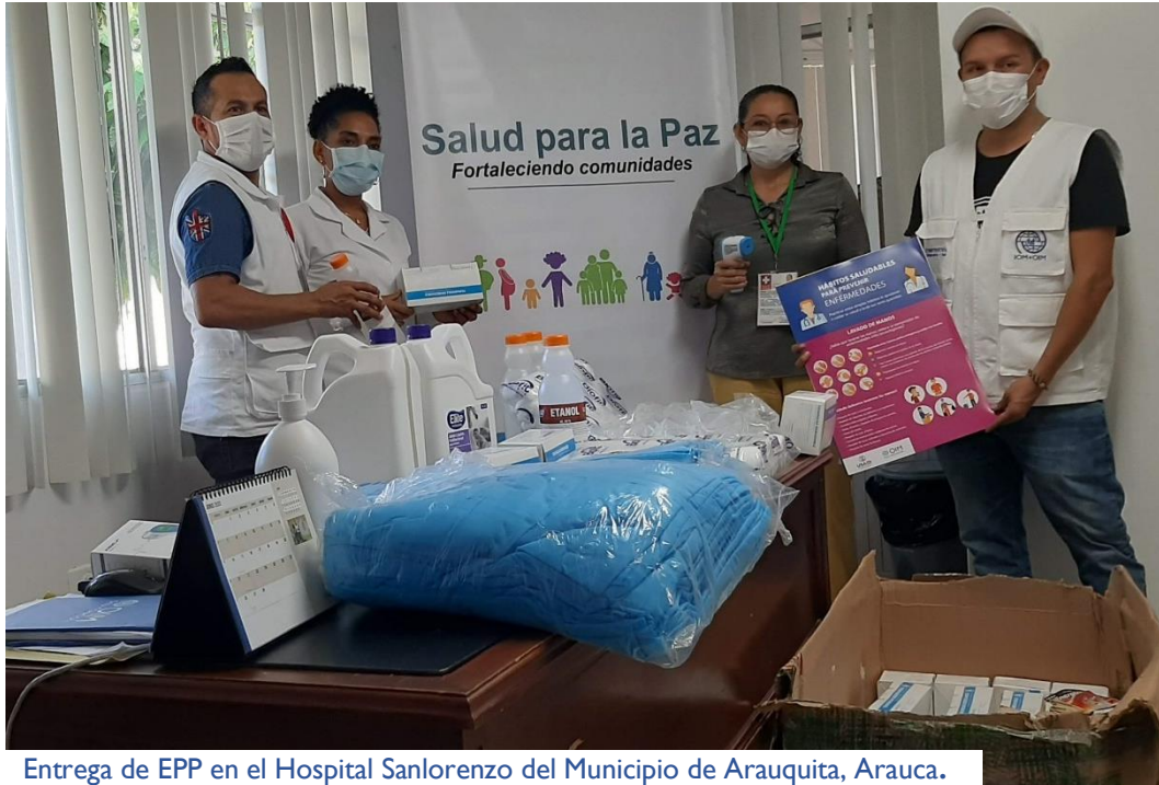
Entrega de EPP en el Hospital Sanlorenzo del Municipio de Arauquita, Arauca.