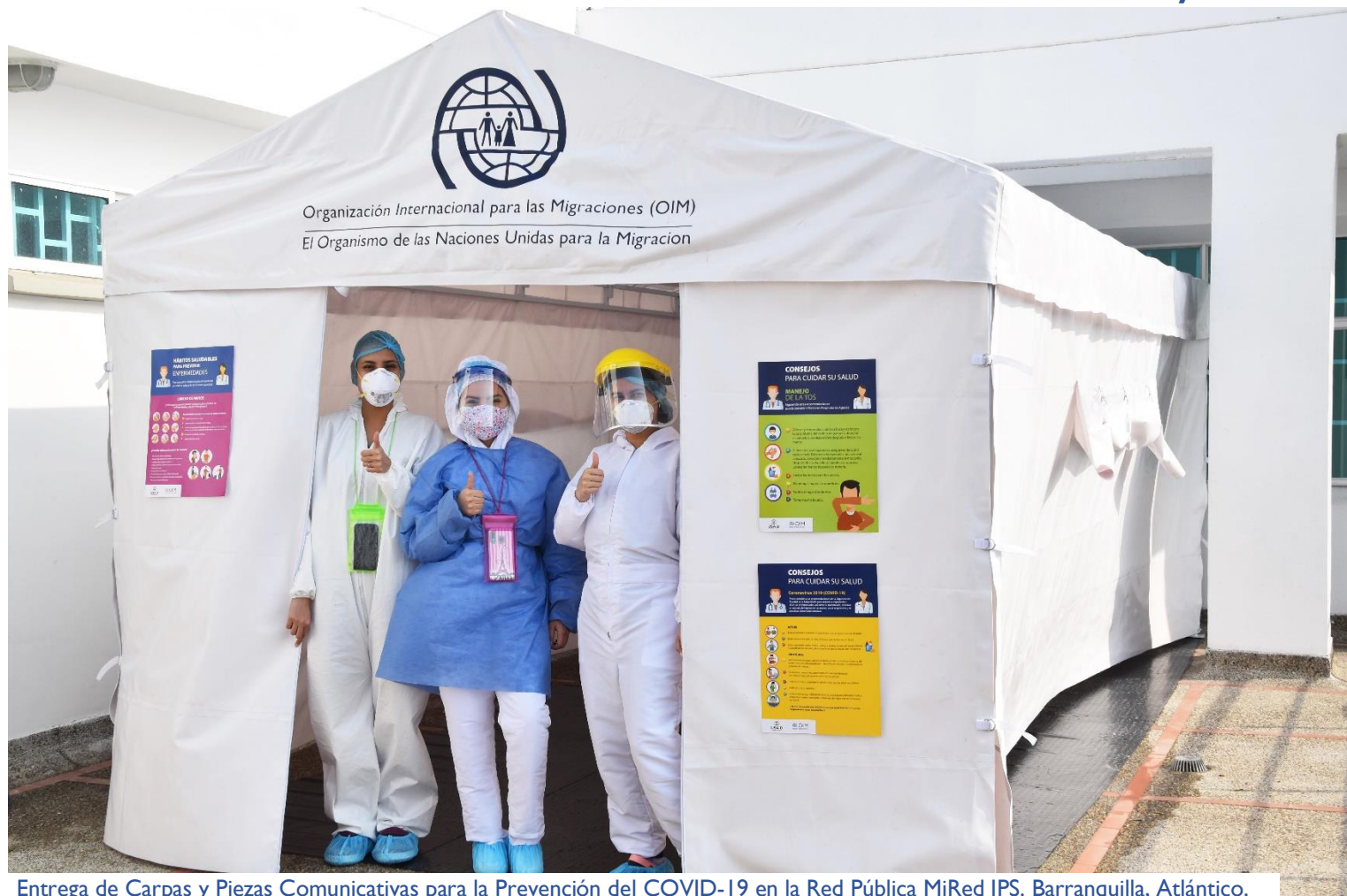
Entrega de Carpas y Piezas Comunicativas para la Prevención del COVID-19 en la Red Pública MiRed IPS. Barranquilla, Atlántico.