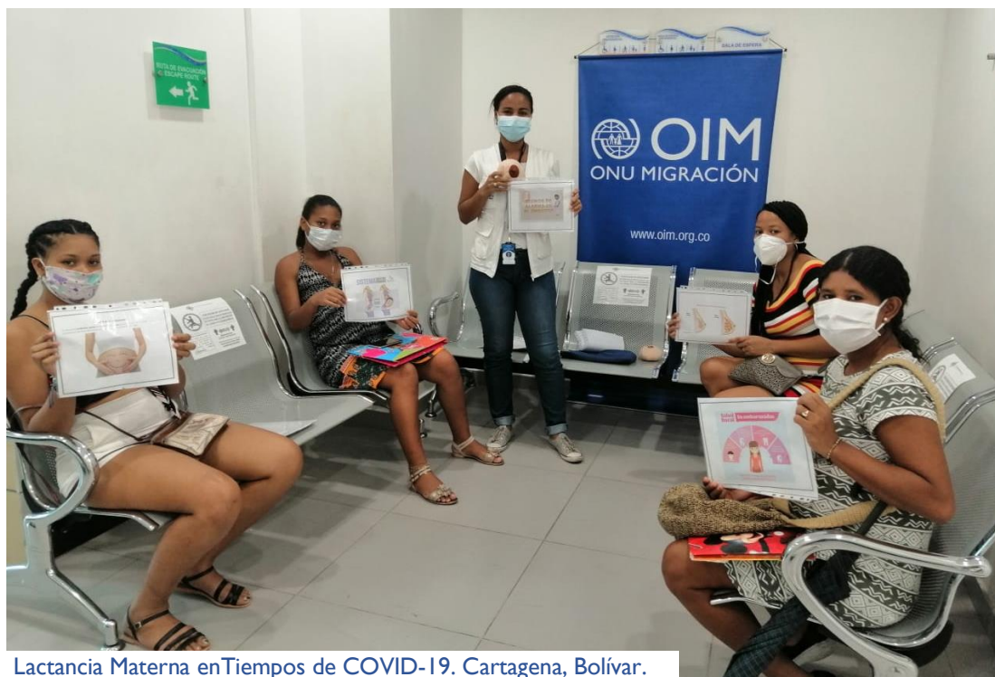
Lactancia Materna en Tiempos de COVID-19. Cartagena, Bolívar.