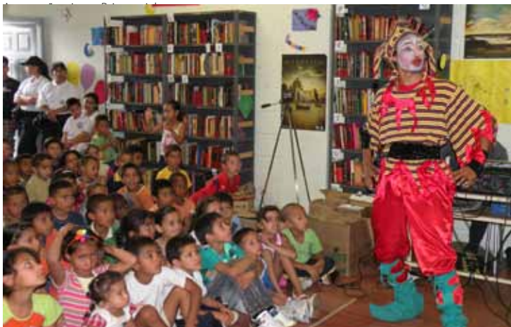
Actividad comunitaria Biblioteca La Avanzada, proyecto consolidado en el marco del proceso Comunidades Constructoras de confianza y reconciliación. Medellín, 2010.