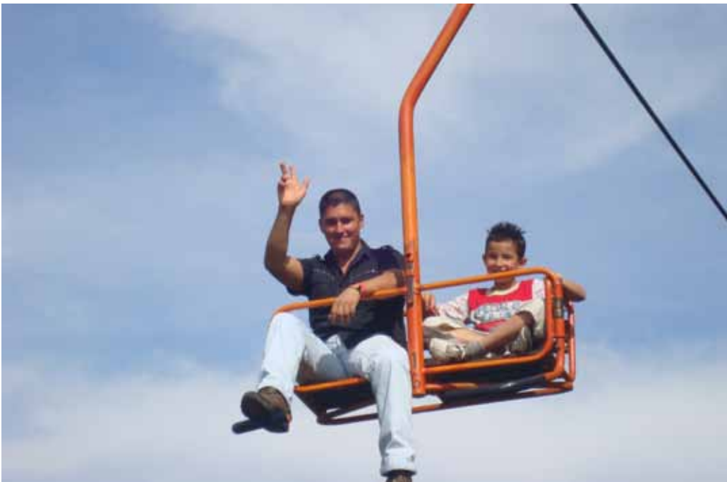
Actividad lúdica de integración con participantes y sus familias. Medellín, 2010.