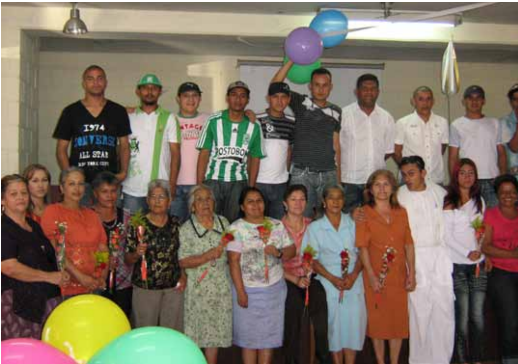
Actividad de integración familiar. Celebración día de la madre. Medellín, 2010.