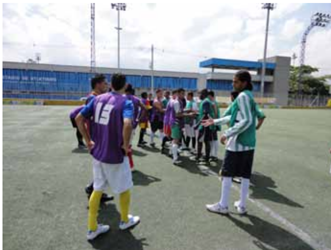
Torneo de fútbol “Por una Medellín sin Fronteras”, en el que se integraron alrededor de la convivencia y el deporte participantes del Programa Paz y Reconciliación, jóvenes vulnerables al conflicto y comunidad. Medellín, 2011.