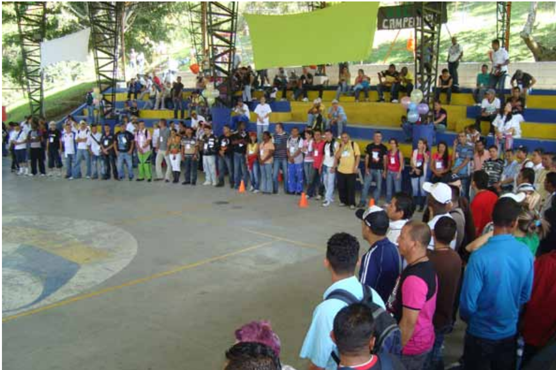
Evento de integración Feria de los Valores, con participantes en ruta avanzada de reintegración social y económica. Medellín, 2009.