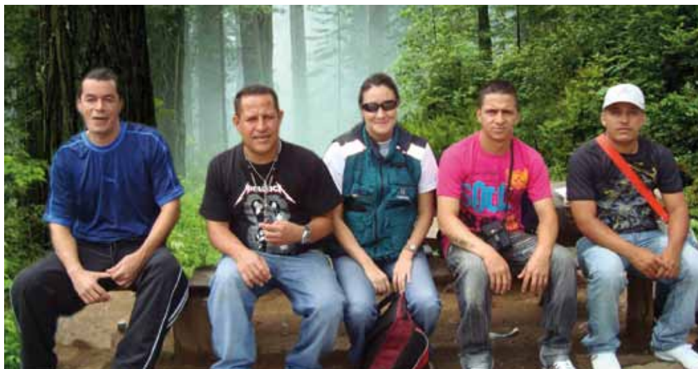
Profesional y grupo de participantes en actividad lúdica – psicosocial. Medellín, 2010.