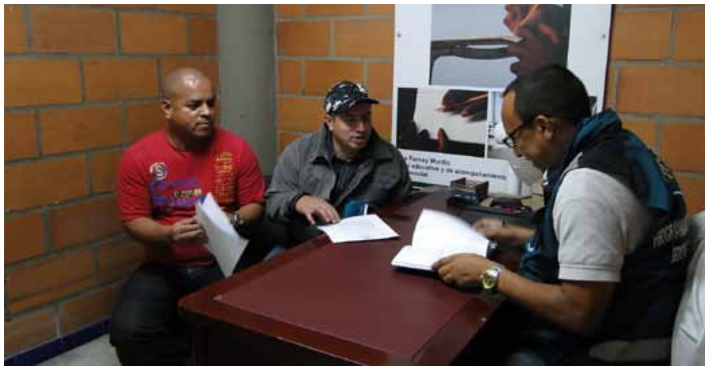
Atención de participantes en psicología clínica. Medellín, 2011.