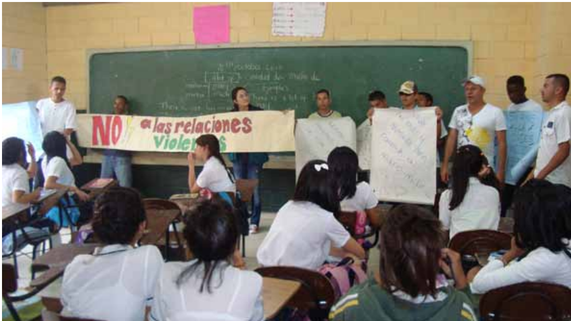
Sensibilización de participantes en proceso de reintegración con estudiantes de secundaria, con motivo de la celebración del Día Mundial por la Paz. Medellín, 2010.