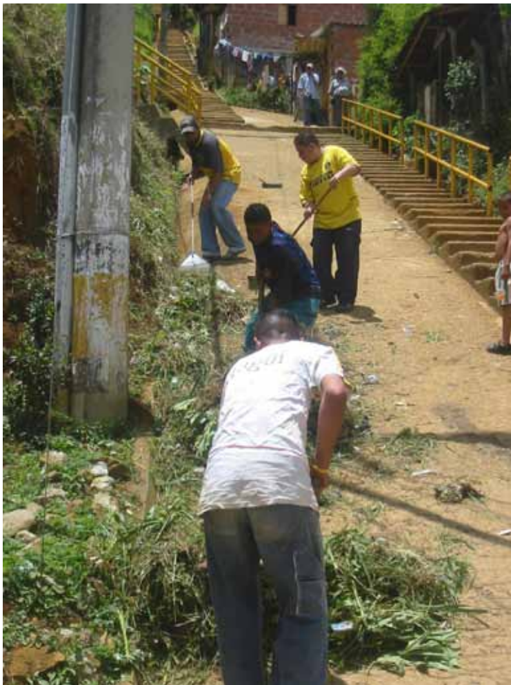
Actividades de reparación simbólica en recuperación de espacios de uso público. Medellín, 2007.