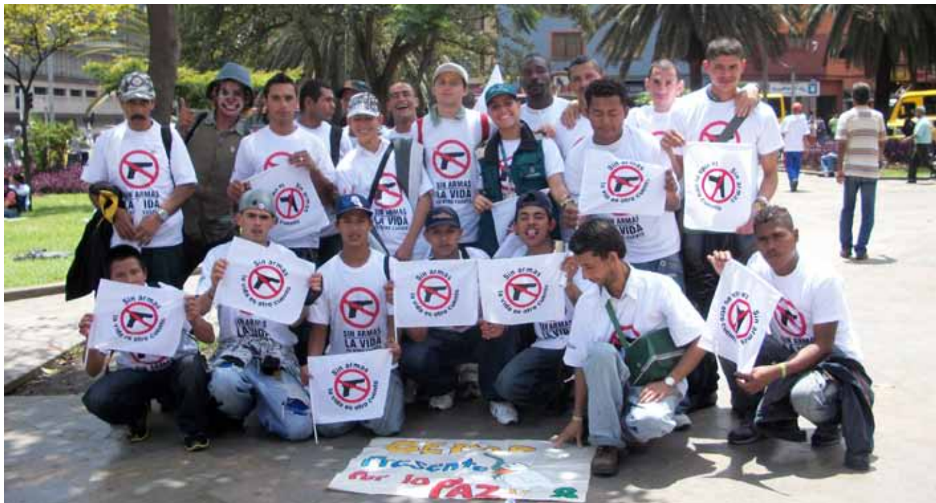
Participación de estudiantes del Centro de Formación para la Paz y la Reconciliación – CEPAR – en actividades de Semana por el Desarme. Medellín, 2010.

cales, dejando ver con esto, cierta legitimidad de estas fuerzas ilegales, e ilegitimidad hacia las fuerzas estatales. Las normas que se respetaban por parte de los desmovilizados eran las impuestas por sus comandantes, y las normas que se respetaban por parte de algunas personas en los barrios, en parte, eran las establecidas por los GAI, en este caso, las AUC.