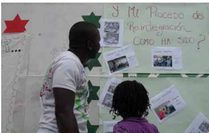
Actividad de reflexión psicosocial con participantes y su familia. Medellín, 2010.