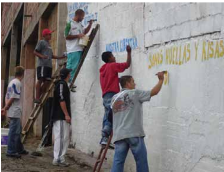
Participantes en actividad de reparación simbólica, recuperación de espacios de uso comunitario. Medellín, 2007.