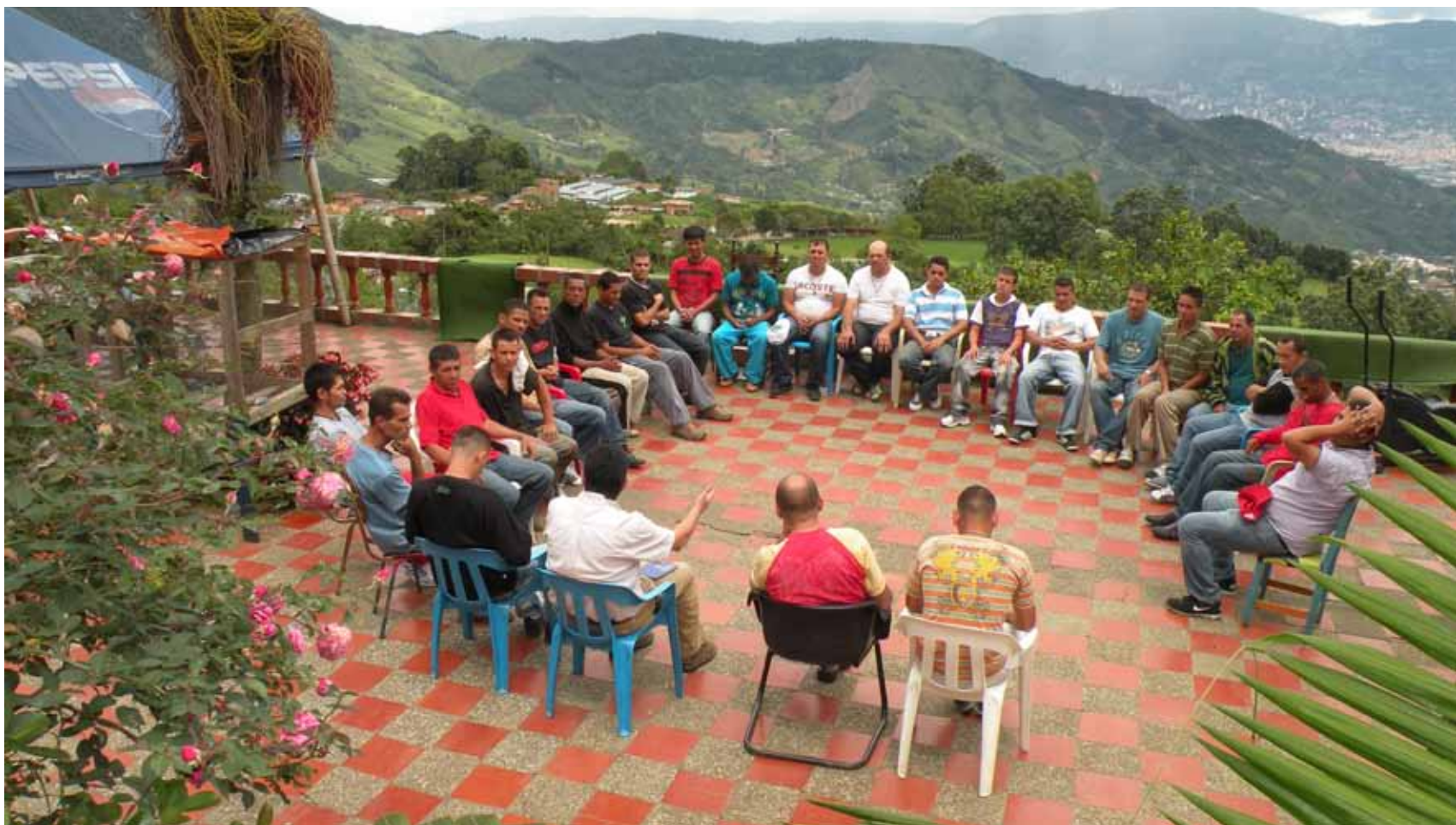
Grupo de participantes atendidos en ruta especial de intervención, por tratamiento de farmacodependencia. Medellín, 2011.