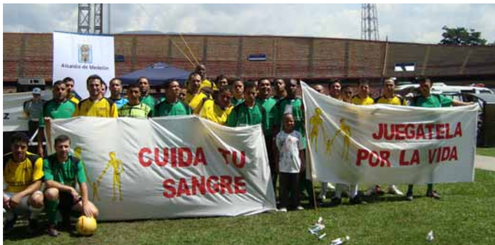
Encuentro de fútbol "Juegátela por la vida" entre participantes en proceso de reintegración y profesionales que realizan el acompañamiento desde la institucionalidad. Medellín, 2009.