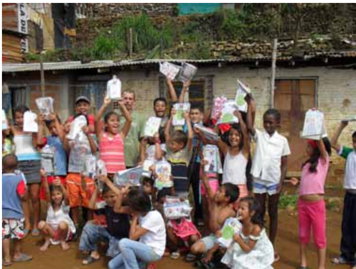
Acto de reparación simbólica, entrega de útiles escolares donados por participantes a niños de escasos recursos en el sector San Blas de la Comuna 3 – Manrique. Medellín, 2011.