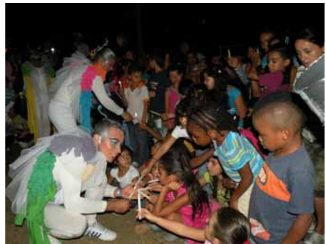
Integración cultural “La vida es todo un cuento”, realizada en el Cerro de los Valores en la Comuna 8 – Villa Tina. Medellín, 2011.