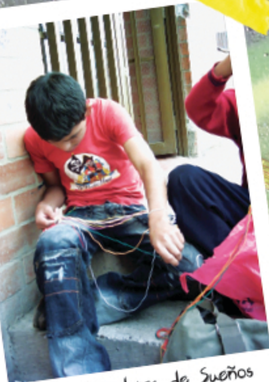
Tejedores de Sueños

Aldebarán: se desarrollan procesos productivos y de carácter social, a través de las artes plásticas y escénicas con base en la cultura colombiana y la participación juvenil.