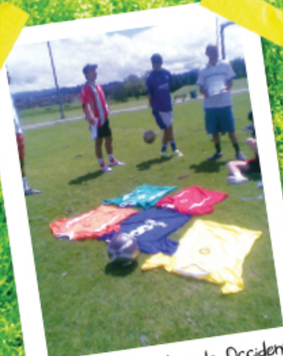
Agrupación Deportiva de Occidente

Disturbio Rojo Bogotá: "lo primero que hacemos es seguir al América por todo lado como barra, pero también nos acercamos a la comunidad para cambiar el imaginario que se tiene de nosotros. Trabajamos desde recoger fondos para ayudar a los ancianos hasta proyecciones de películas donde al final contamos que los barris-