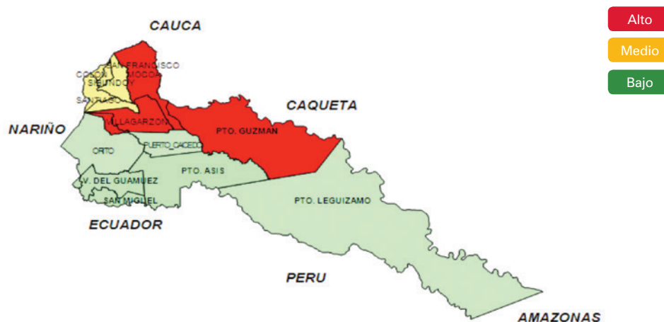
Gráfico 1. Mapa división administrativa del Putumayo

Demografía: Según las proyecciones de población del DANE para el año 2014 la población total del departamento es de 341.034 habitantes, aproximadamente el 0.71% de la población nacional. Del total proyectado el 50,7% son hombres y el 49,3% mujeres.