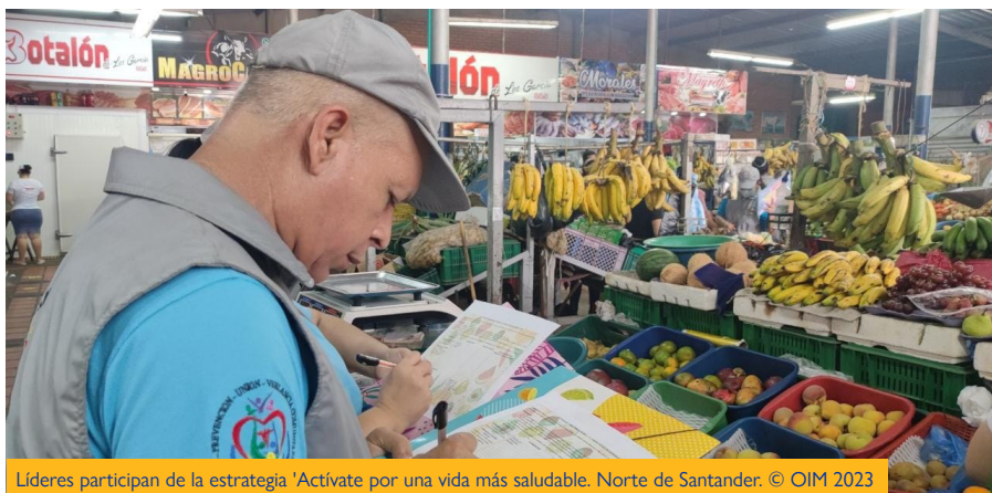
Líderes participan de la estrategia 'Actívate por una vida más saludable. Norte de Santander.

Personas accedieron a atenciones especializadas de salud mental, con servicios de psicología clínica, psiquiatría y neurología.