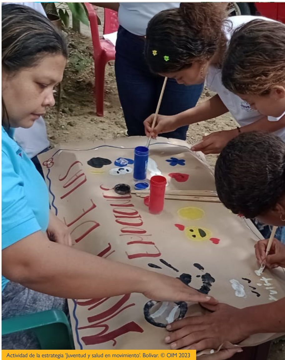
Actividad de la estrategia 'Juventud y salud en movimiento'. Bolívar.

Aportamos al fortalecimiento de habilidades para la vida en las comunidades, a través de prácticas de autogestión, autocuidado e integración comunitaria.