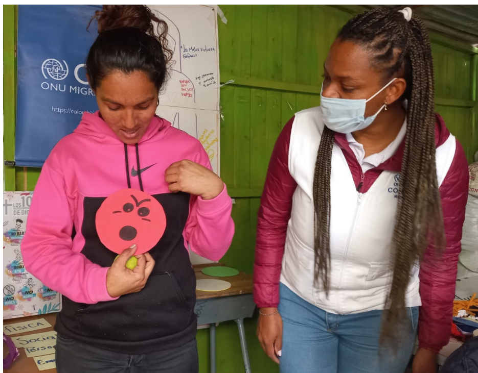
Creatividad para resignificar la vida de mujeres migrantes. Soacha.

Las participantes se dedican a la recolección y reciclaje de material plástico, un oficio que no hacía parte de sus prácticas cotidianas en su lugar de origen, por lo que esta actividad se centró en fortalecer su identidad y resignificar su labor, a través de la producción de manualidades con fines de comercialización. Este, ha sido un proceso creativo, de expresión y de bienestar para las participantes, y un medio de intercambio de experiencias y de fortalecimiento de las relaciones en la comunidad.