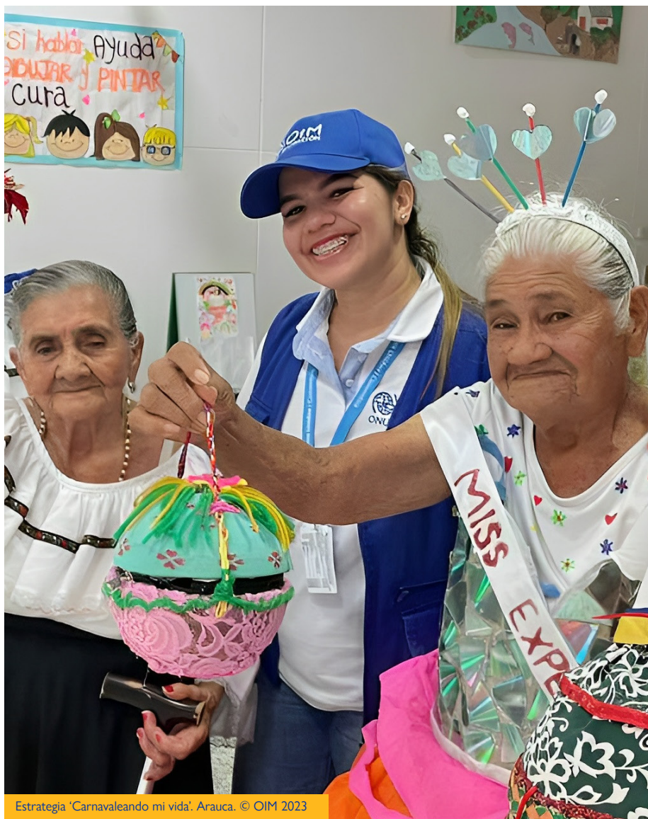
Estrategia 'Carnaveando mi vida'. Arauca.

Impulsamos el fortalecimiento de la cohesión social en las comunidades, con lo cual se aumenta el apoyo mutuo y la búsqueda de ayuda en situaciones adversas.