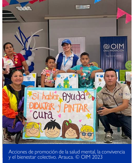
Acciones de promoción de la salud mental, la convivencia y el bienestar colectivo. Arauca.

Esta iniciativa se hizo mediante sesiones lúdico-educativas, donde los líderes capacitaron a la comunidad en el diseño de estrategias para el uso adecuado del tiempo libre; el manejo y comprensión de las emociones, la integración comunitaria en los diferentes momentos del curso de vida, la escucha activa y rutas de salud mental en el municipio.