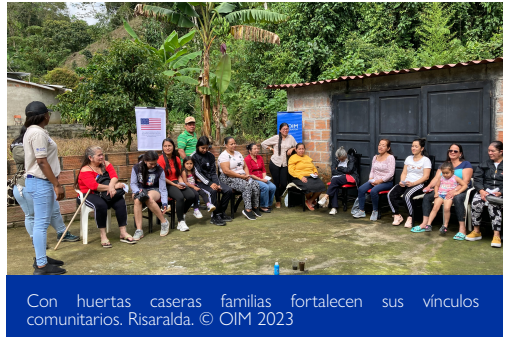
Con huertas caseras familias fortalecen sus vínculos comunitarios. Risaralda.

Esta fue una acción que resultó de la articulación de varias entidades, donde la OIM y la Alcaldía Municipal brindaron capacitación y apoyo en la materialización de las huertas. Además, permitió favorecer la integración, la convivencia y el intercambio de conocimientos y experiencias comunes para la búsqueda de respuestas a necesidades comunes.