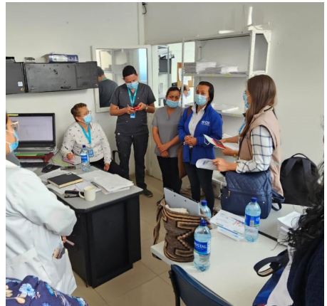
Sesión de fortalecimiento del talento humano. Boyacá.

En estos encuentros participaron 85 profesionales de áreas asistenciales como administrativas.