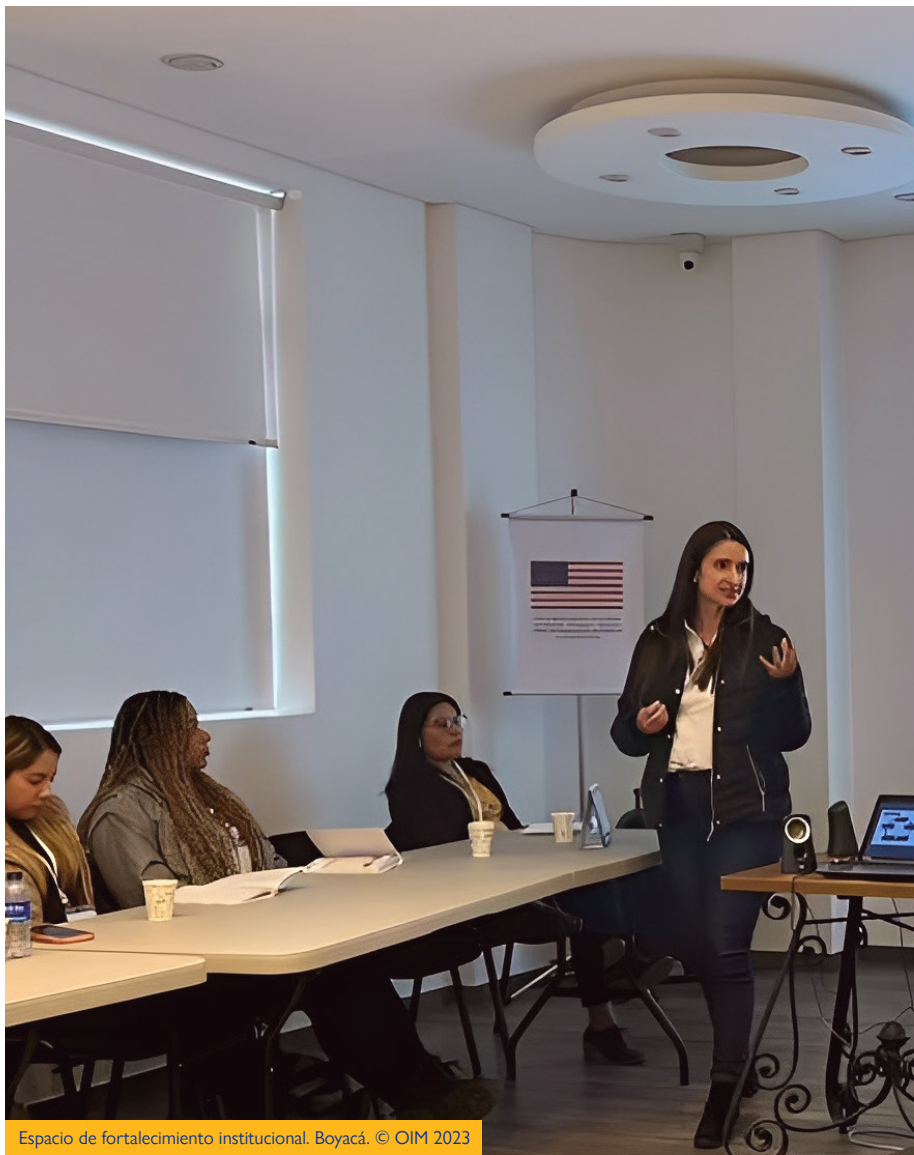
Espacio de fortalecimiento institucional. Boyacá.

Seguimos aportando a la sensibilización y coordinación con los actores locales sobre la importancia de un abordaje intersectorial y libre de discriminación en la promoción de la salud mental en los territorios.