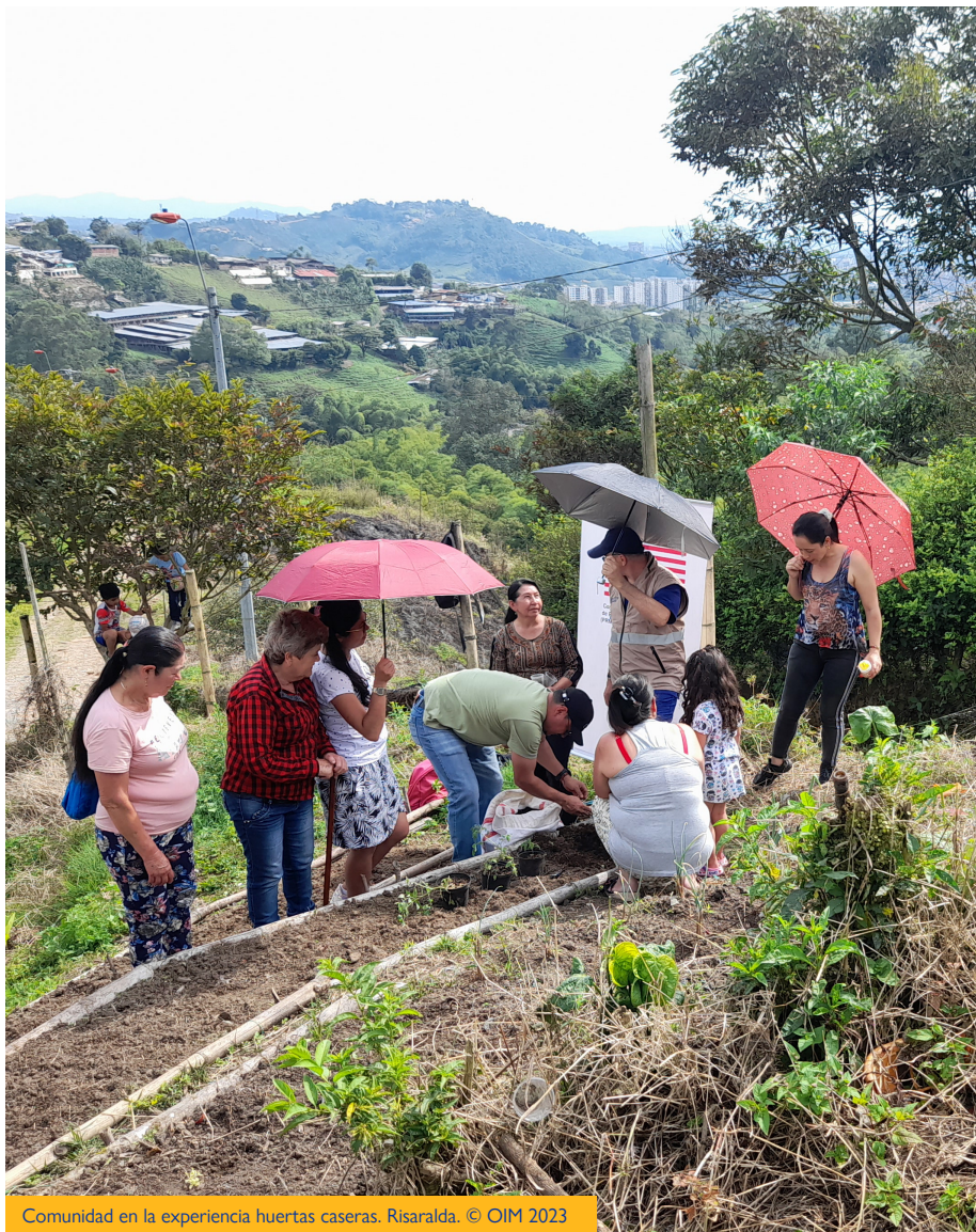
Comunidad en la experiencia huertas caseras. Risaralda.

Acompañamos la creación y el fortalecimiento de entornos protectores y resilientes como espacios de socialización y sana convivencia en zonas altamente vulnerables.