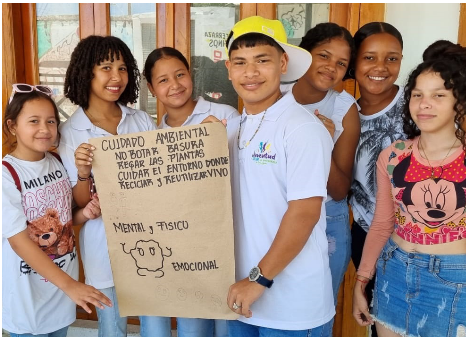
Niños, niñas, adolescentes y jóvenes promueven al salud al ritmo de la música y la cultura. Bolívar.

Esta acción ha sido acompañada por la OIM de mano con el Departamento Administrativo Distrital de Salud – DADIS y la Policía de Infancia y Adolescencia.