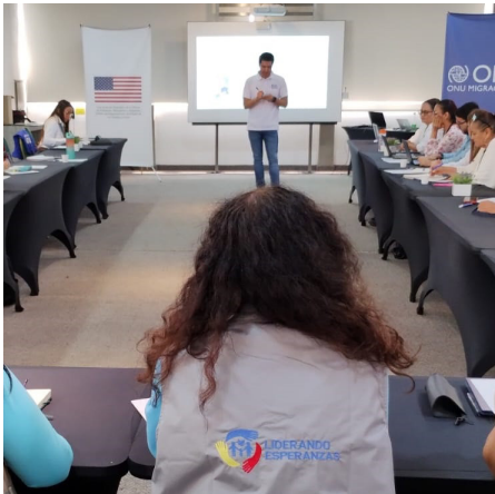
Entidades de salud y líderes son fortalecidos en SMAPS. Valle del Cauca.

Durante el primer semestre de 2023, la OIM, en coordinación con entidades sanitarias, realizó tres encuentros de diálogo técnico con más de 70 representantes de las autoridades territoriales de salud, prestadores de servicios, agencias de cooperación y otras instituciones locales de Cali, Valledupar y Riohacha, con el propósito fortalecer las capacidades y la articulación técnica y operativa en la implementación de acciones de SMAPS de base comunitaria para favorecer a refugiados y migrantes, y comunidades de acogida, en armonía con la política pública de salud mental definida por el Ministerio de Salud y Protección Social.