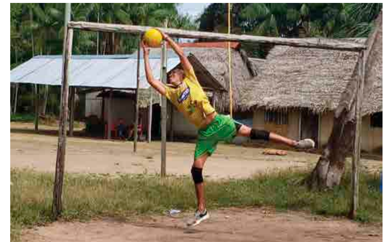
Los jóvenes venezolanos y colombianos, a través del deporte se integran y conviven. Inírida. 2021.

La estrategia, diseñada junto con los líderes y lideresas de la Red Comunitaria de Salud ‘Unidos por un mejor mañana’, ha permitido espacios de sensibilización sobre la importancia de la actividad física, el desarrollo de estrategias para el cuidado colectivo, el uso sano del tiempo libre y el mejoramiento de las relaciones humanas.