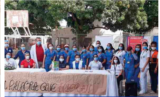
Santa Marta, Magdalena | Día Mundial de la Eliminación de la Violencia contra las Mujeres.