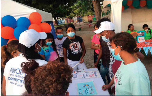
Maicao, La Guajira | Día Mundial de la Prevención de Suicidio.

Las acciones de prevención y promoción de la salud mental y el bienestar psicosocial llegaron a las comunidades de refugiados y migrantes y de acogida en fechas y conmemoraciones importantes para la gestión de la salud.