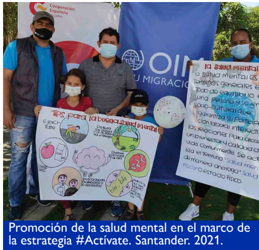
Promoción de la salud mental en el marco de la estrategia #Actívate. Santander. 2021.

91 gestantes nacionales venezolanas asentadas en los barrios Bavaria II, Café Madrid, Campo Madrid, Parque de las Cigarras y Antonia Santos del municipio de Bucaramanga recibieron la vacuna contra el COVID-19, luego de participar de una de las jornadas realizadas en este territorio en el marco de la estrategia #Actívate.