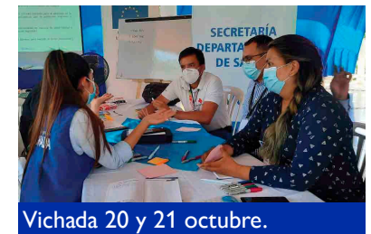
Vichada 20 y 21 octubre.