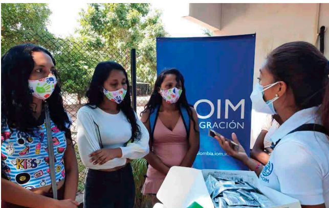
Vichada | Día Mundial del SIDA.