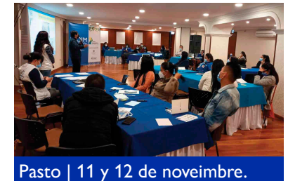
Pasto | 11 y 12 de noviembre.