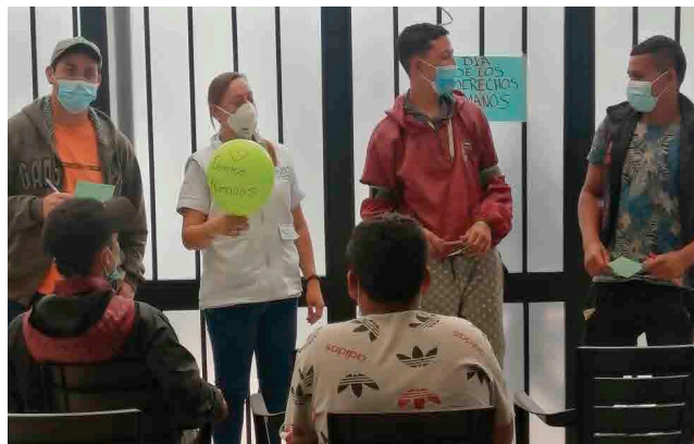
Bogotá | Día Mundial de los Derechos Humanos.