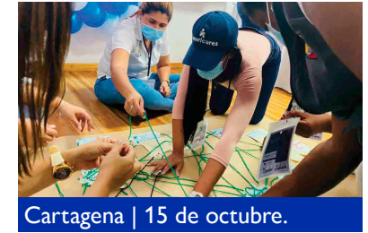
Cartagena | 15 de octubre.