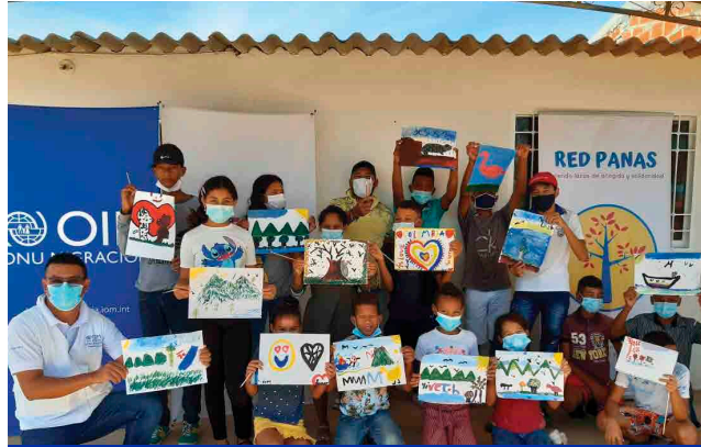
Valledupar, Cesar | Día Mundial de la Salud Mental.