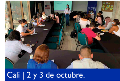
Cali | 2 y 3 de octubre.