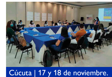
Cúcuta | 17 y 18 de noviembre.