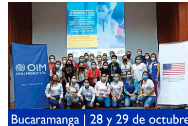
Bucaramanga | 28 y 29 de octubre.