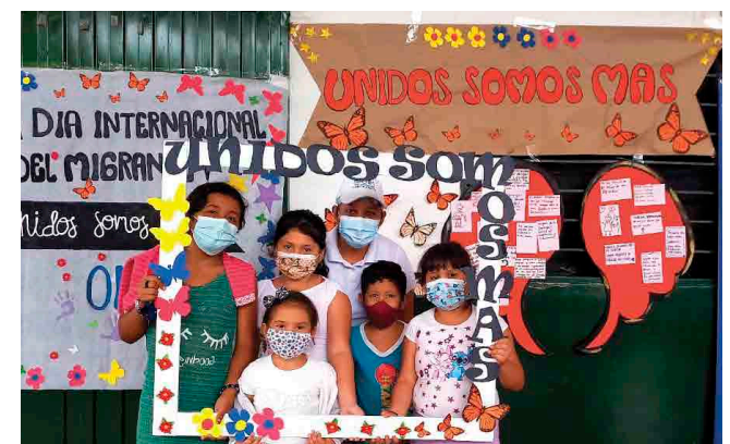
Norte de Santander | Día del Migrante.