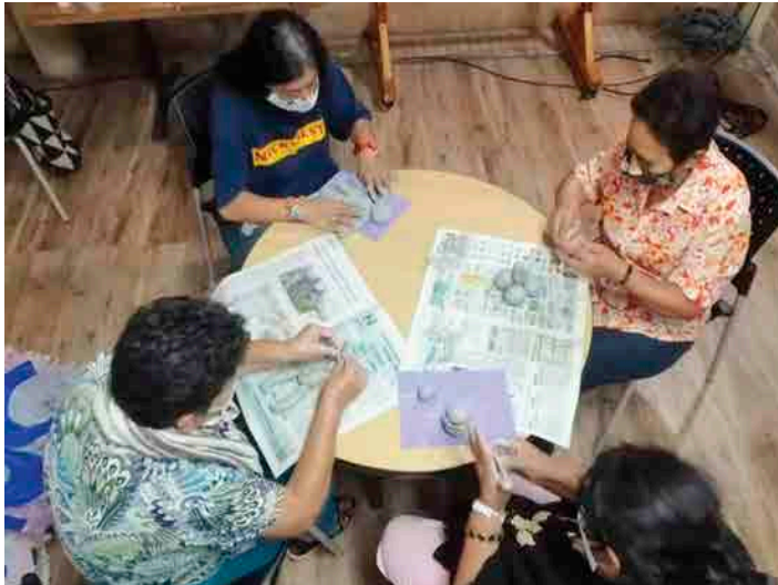
Mujeres realizando ejercicios con arcilla durante el taller. Antioquia. 2021.