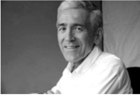
1. FRANCISCO JOSÉ DE ROUX