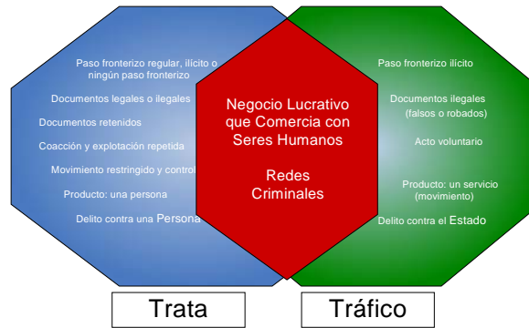
Gráfico 1.

Podemos complementar este esquema síntesis que viene trabajando la Organización Internacional para las Migraciones con las siguientes reflexiones: