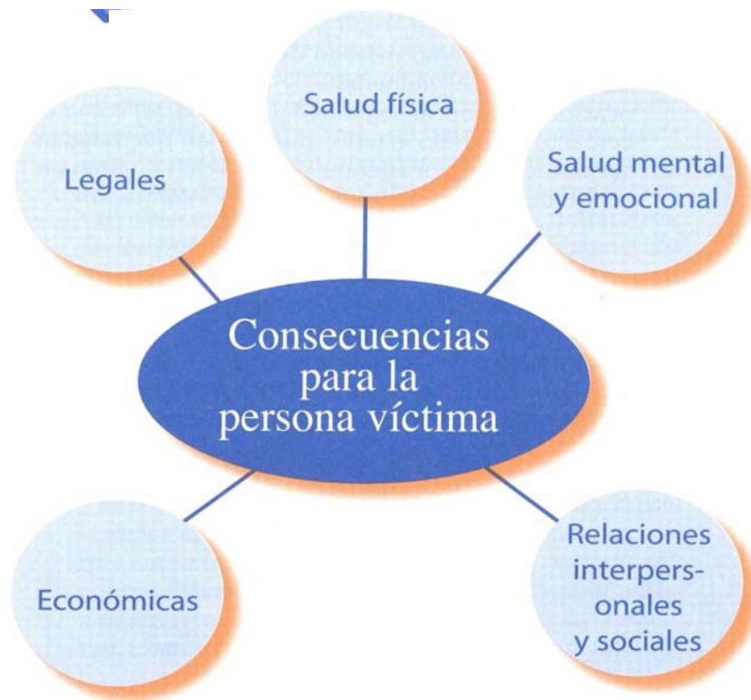
Gráfico 2.

humanos. Las víctimas de trata de personas están expuestas a un riesgo que puede producir como se muestra en el Gráfico 2, daños físicos y psicológicos (salud mental y emocional), exclusión del sistema educativo, consecuencias legales (en casos de situación de irregularidad migratoria en donde se presentan violaciones a los derechos humanos, económicas y de relacionamiento interpersonal).