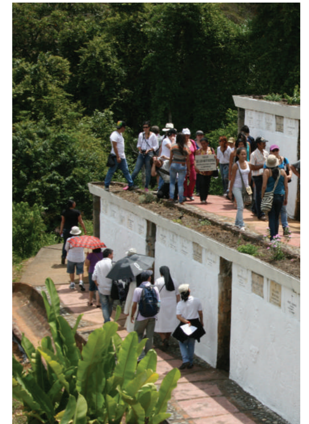
Conmemoración 25 años masacre Trujillo, Valle del Cauca, 2012

El Parque Monumento Trujillo tiene como propósito recordar a las víctimas, recuperar el tejido y el vínculo social destruido a raíz de la masacre, y trabajar por la no repetición y la reconciliación, como lo ilustra el siguiente fragmento de sus documentos propios: