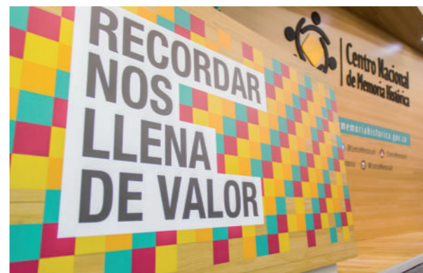
Feria del Libro, mayo 2014