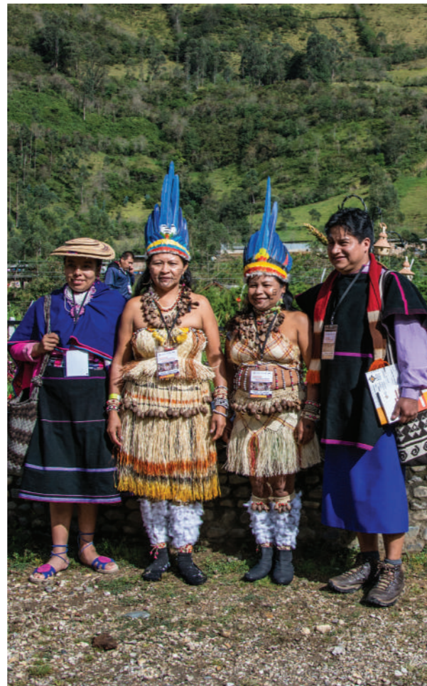
Encuentro de pueblos indígenas Puracé, Coconuco, agosto 2013

La comunidad indígena del pueblo de los Pasto, que habita en la vereda la Boyera, en el resguardo el Cumbal, al suroccidente colombiano, ha construido “La Casa del Saber” como su lugar de memoria. Al referirse a la misma comunidad manifiesta: “La Casa de Saber es un espacio para recrear el tejido, la palabra y hacer actividades culturales y religiosas de interés de la comunidad”. 24