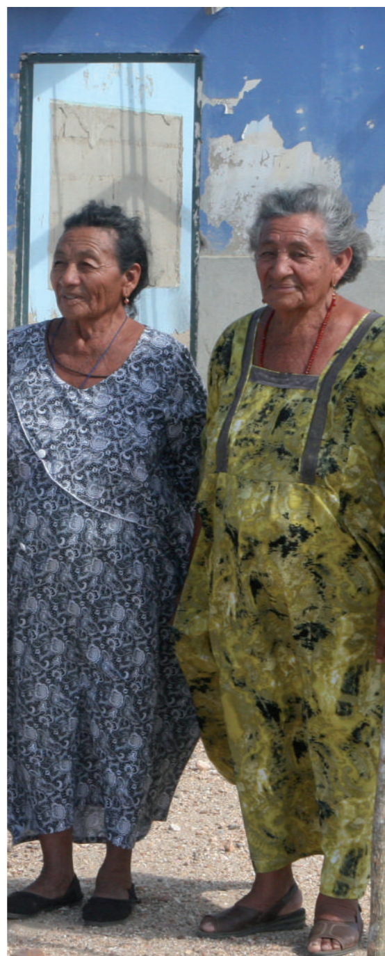
Bahía Portete

En esta sección se describen los pasos que pueden orientar la definición, puesta en marcha y seguimiento de una acción de memoria histórica por parte de autoridades territoriales con criterios de viabilidad técnica, financiera y social. Se plantean unas recomendaciones específicas para la incorporación del enfoque diferencial y la perspectiva de género en los proyectos de memoria histórica y se abordan las herramientas e instrumentos que el CNMH pone a disposición de las autoridades territoriales para orientar la formulación de acciones de memoria histórica como proyectos en el marco de los Planes de Acción Territorial –PAT. Estas herramientas son: la ficha de formulación de proyectos y las estrategias de financiación para el desarrollo de acciones de memoria histórica.