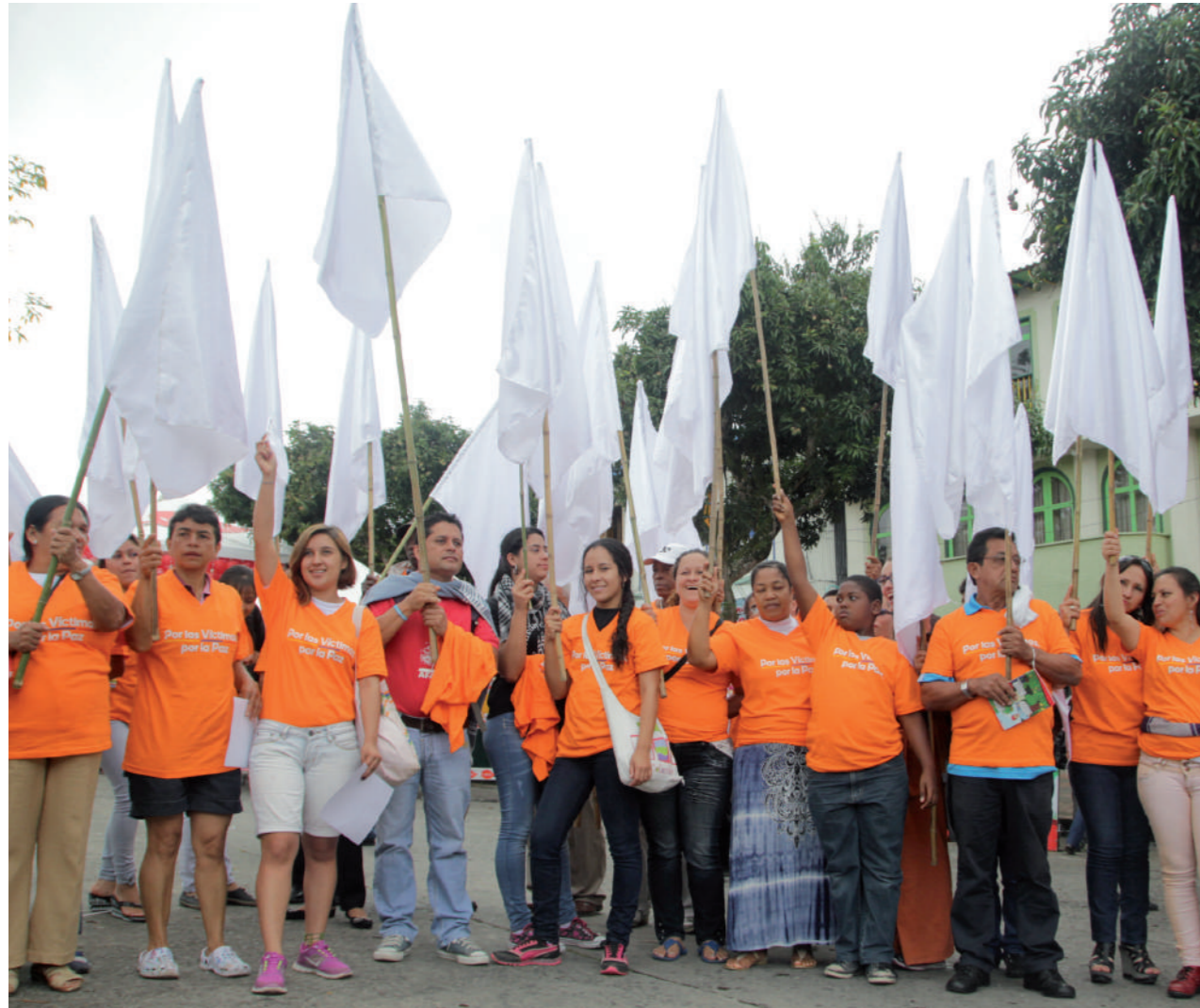
Marcha hacia el cementerio, Marsella, Risaralda, noviembre 2013

La metodología de trabajo de la Estrategia Nación-Territorio parte del hecho de que no todas las entidades territoriales tienen la misma capacidad técnica, administrativa y presupuestal para llevar a cabo el mismo tipo de programas o proyectos de memoria histórica por lo que el tipo de apoyo técnico