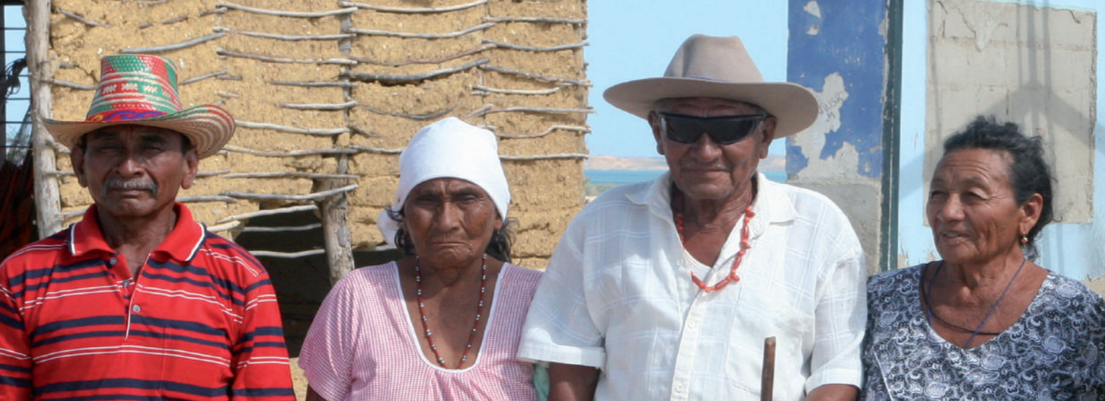
Bahía Portete

Después de seis décadas de conflicto armado interno y múltiples esfuerzos por encontrar una salida negociada a la guerra, el Congreso de la República, por iniciativa del Gobierno Nacional, aprobó la Ley 1448 de 2011 conocida como la Ley de Víctimas y Restitución de Tierras.