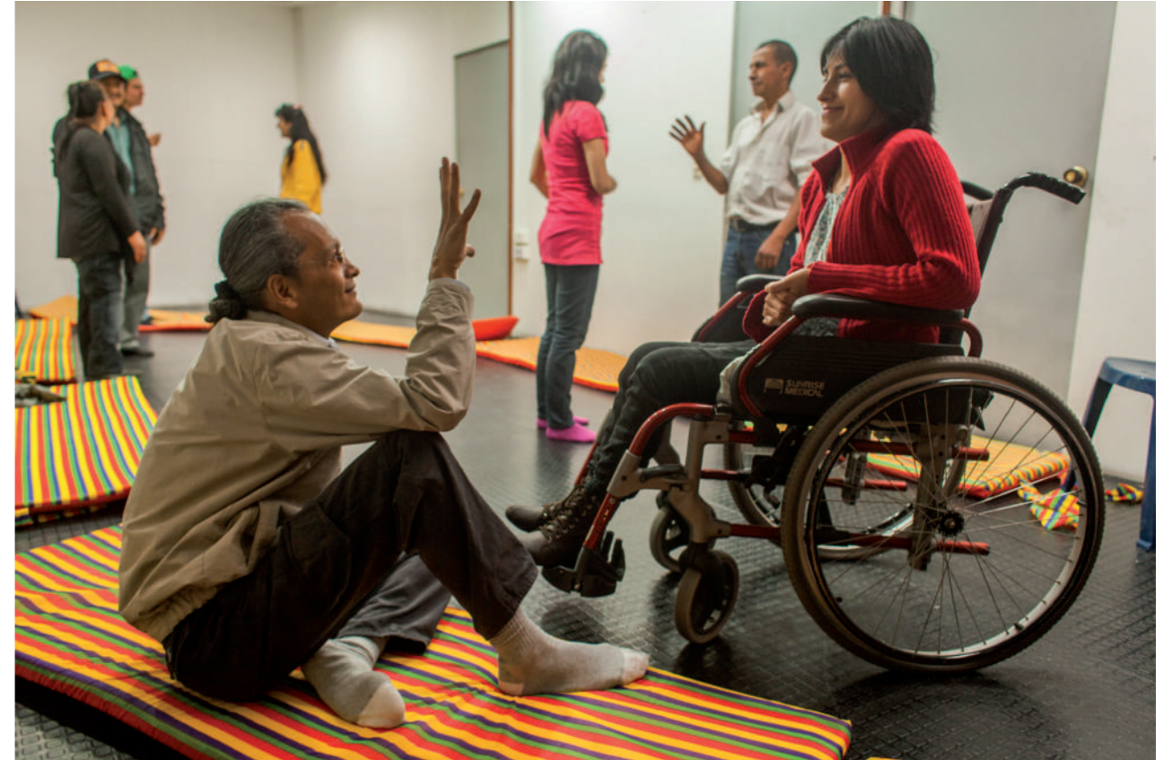
Taller con enfoque de discapacidad, Bogotá, diciembre 2013