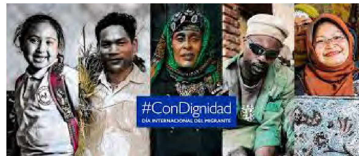
Imagen de la campaña #ConDignidad

los países de tránsito y, especialmente, de las comunidades receptoras en los países de destino. Al tiempo que renueva el llamamiento para que se salven vidas al garantizar una migración segura, regular y digna para todos.