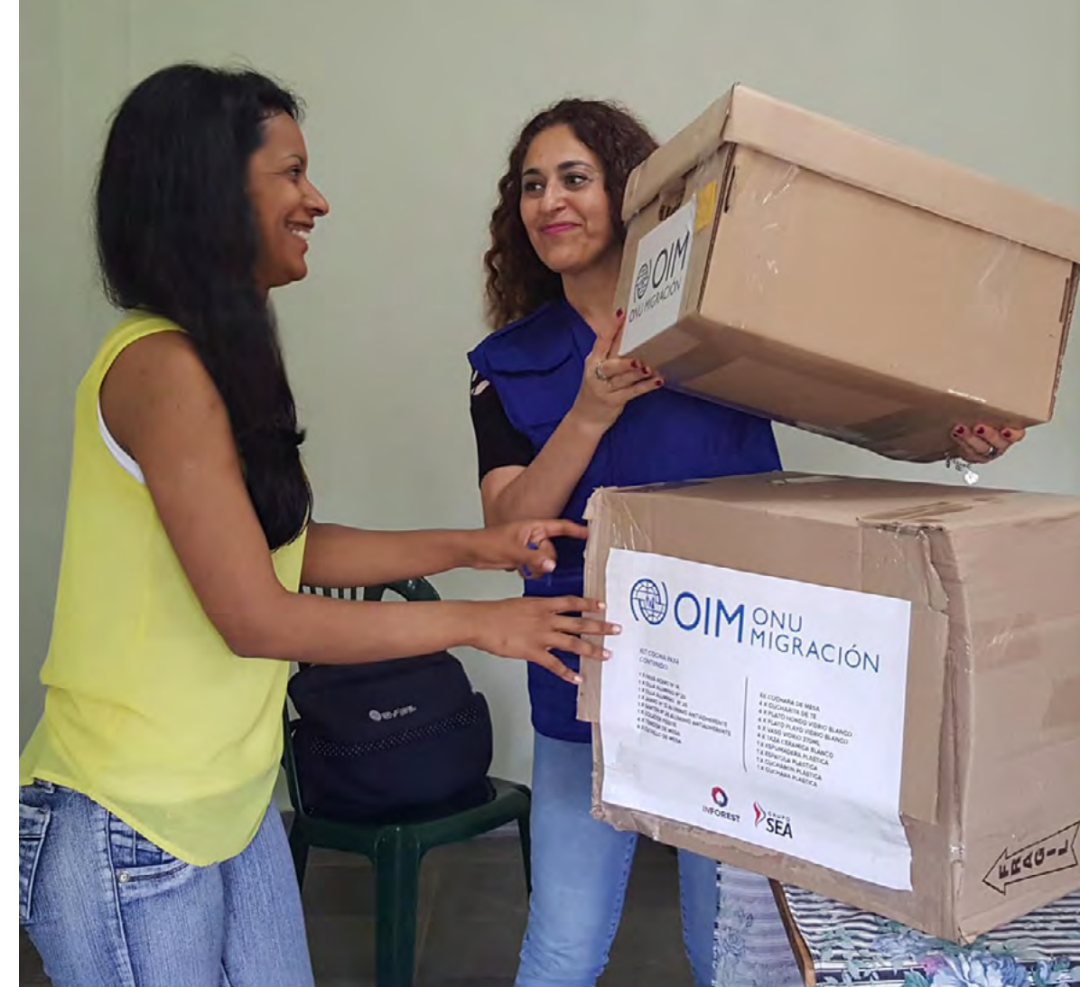
Entrega de los kits de asistencia a venezolanos/as residentes en Argentina

culos esenciales. Tuvimos la oportunidad de escucharlos y nos conmovimos con sus historias de resiliencia. Desde la OIM continuaremos respondiendo a estas necesidades con el mismo compromiso durante 2019”.