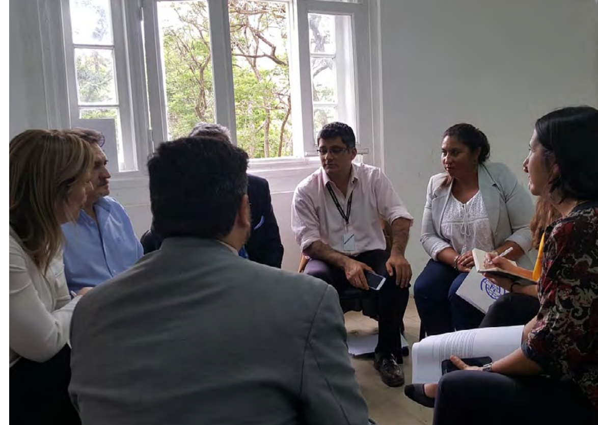
Trabajo en talleres

En la actividad participaron funcionarios/as de la Sede Central y delegados/as provinciales de la DNM, así como representantes de Gendarmería, Prefectura y de la Policía de Seguridad Aeroportuaria. Asimismo, expusieron referentes del Ministerio de Seguridad; de las Secretarías de Derechos Humanos y Pluralismo Cultural y de Trabajo de la Nación; del Instituto Nacional contra la Discriminación, la Xenofobia y el Racismo; y de agencias de Naciones Unidas.