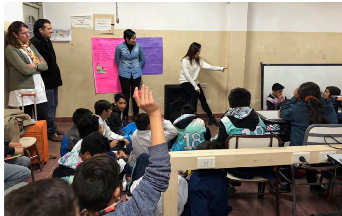
Taller para docentes y estudiantes de una escuela de la ciudad de Uspallata, Mendoza.

El 15 de mayo se llevó a cabo una jornada en la ciudad de La Rioja, en el marco del Programa Siria. Durante el encuentro, que fue declarado de interés por la Cámara de Diputados y el Concejo Deliberante de la Ciudad de La Rioja, se desarrollaron diferentes capacitaciones a cargo de representantes de la Dirección Nacional de Pluralismo e Interculturalidad y de OIM Argentina. La primera capacitación tuvo lugar en el Paseo Cultural Castro Barros y contó con la asistencia de numerosos/as funcionarios/as gubernamentales y de docentes; la segunda fue