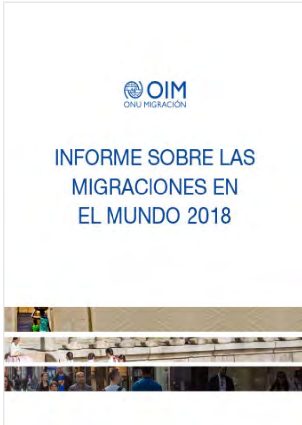
Portada del “Informe sobre las migraciones en el mundo 2018”.

En el mes junio, OIM difundió la versión en español del “Informe sobre las migraciones en el mundo 2018”. Esta edición es la novena de una serie que se inició en el año 2000, y fue producida con el objetivo de fomentar una mayor comprensión de la migración en todo el mundo. El documento presenta datos fundamentales sobre la migración, y capítulos temáticos sobre cuestiones de migración de interés actual. Su estructura ha sido adaptada para centrar su atención en dos contribuciones fundamentales para los lectores: la parte I contiene información fundamental sobre la migración y las personas migrantes (incluyendo estadísticas sobre migración) y la parte II proporciona un análisis equilibrado y empírico sobre cuestiones complejas y emergentes relativas a la migración.