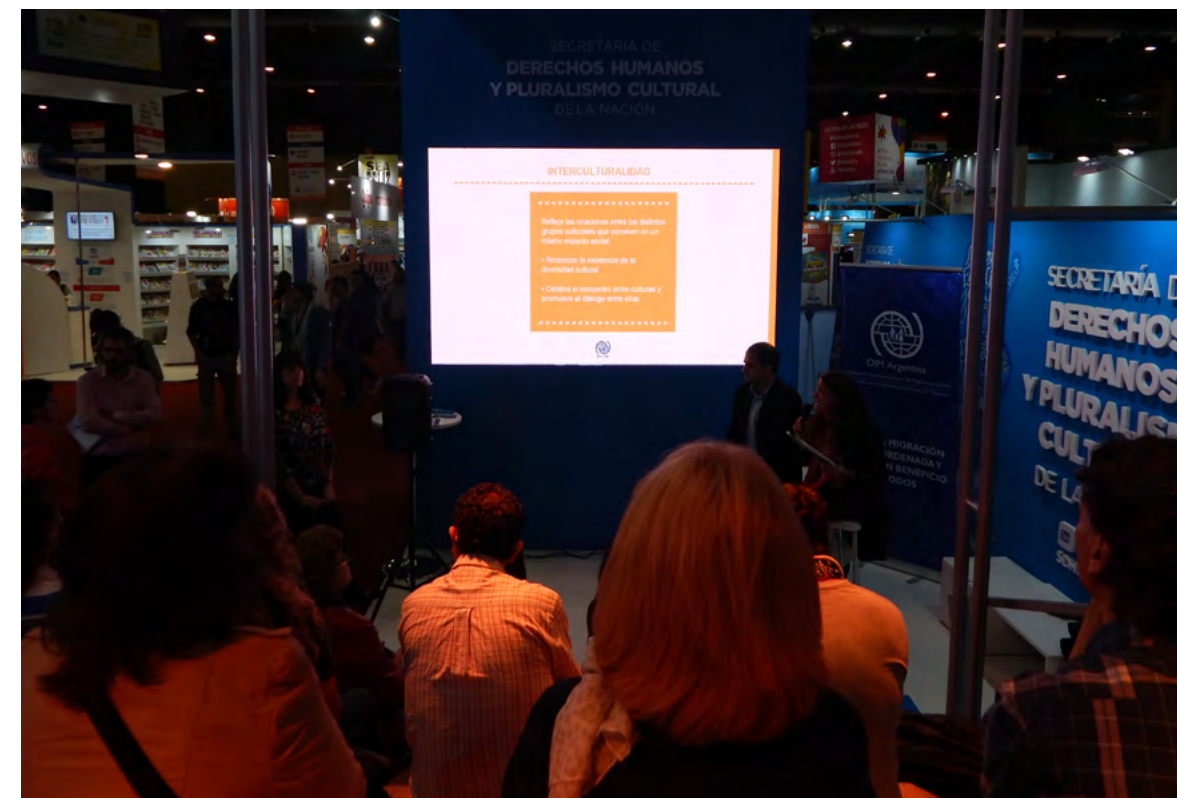
Actividad “Diálogos entre culturas”

En otra de las jornadas de la Feria, se realizó una charla para el público en general sobre el Programa Especial de Visado Humanitario para Extranjeros afectados por el conflicto de Siria que implementa el Gobierno de la Argentina, conocido como “Programa Siria”. Estuvieron a cargo de la actividad representantes gubernamentales, de la OIM y del ACNUR.