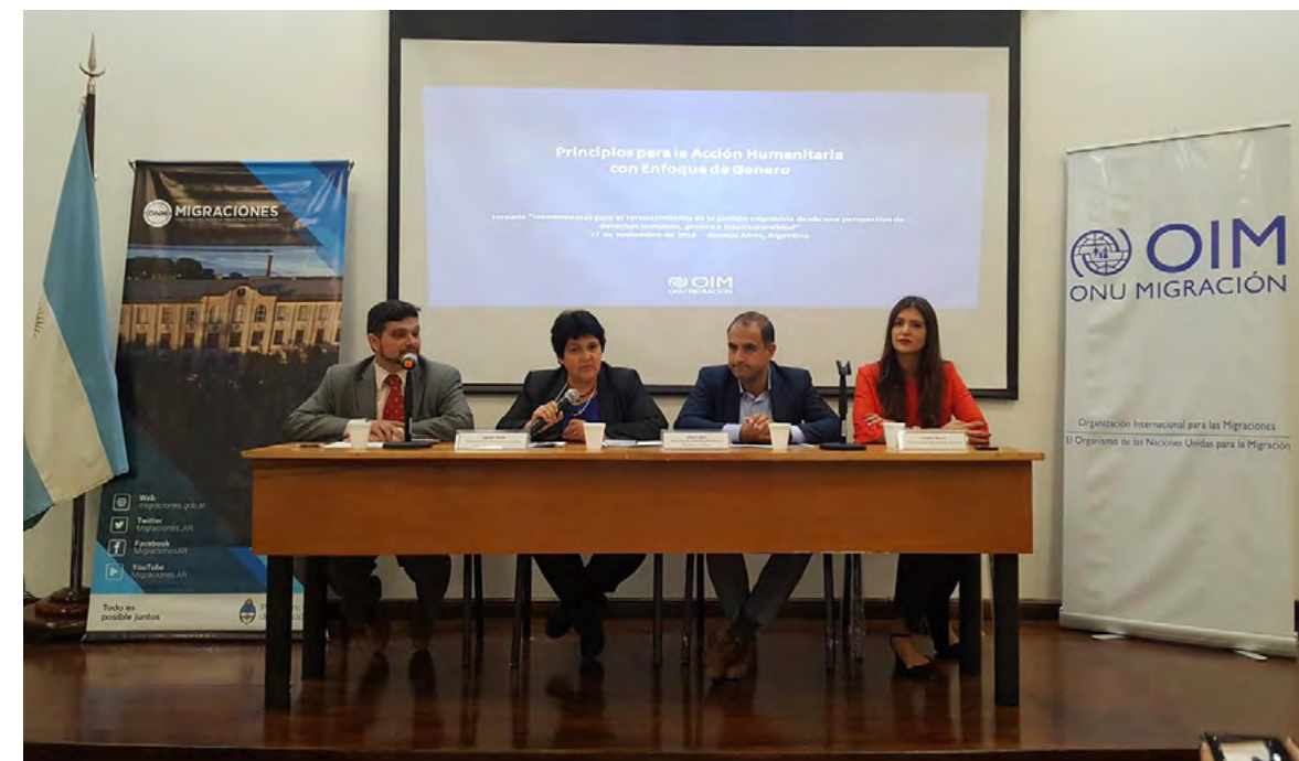
Panel de apertura.

gración (PRM, por su sigla en inglés) del Departamento de Estado de EE.UU., los/as asistentes recibieron información concreta sobre los trámites necesarios para poder ejercer su especialidad, así como datos sobre las posibilidades de inserción laboral en diversas localidades de la Argentina.