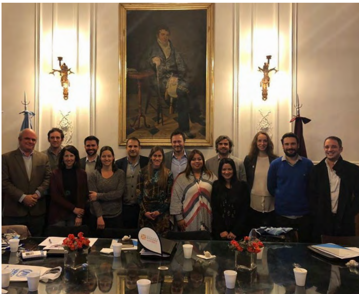
Reunión durante la visita a la provincia de Salta.

asentamiento Emergentes (ERCM, por sus siglas en inglés), como el proyecto financiado por la Unión Europea "Fortalecimiento de la protección internacional, recepción e integración de refugiados en Argentina", implementados en forma conjunta por OIM Argentina y ACNUR para el Sur de América Latina.