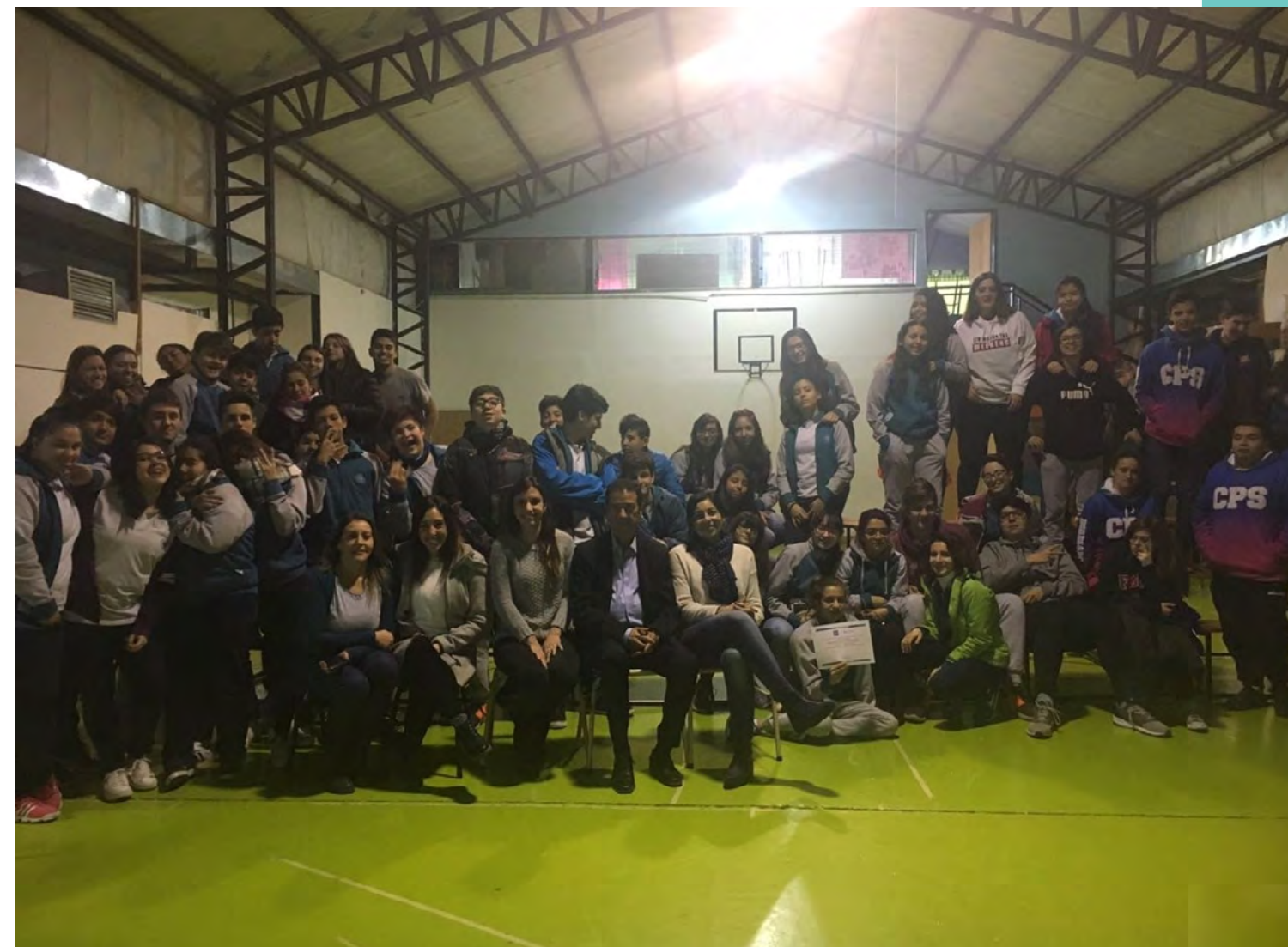
Asistentes a un taller desarrollado en la ciudad de Comodoro Rivadavia, Chubut.

Por último, el 11 de diciembre se llevó a cabo un Taller Intercultural en la ciudad de San Francisco, en la provincia de Córdoba, dirigido a la sociedad civil y a llamantes, en el que se presentaron y compartieron con los asistentes la “Guía Informativa y de Fortalecimiento de la Comunicación Intercultural para la Integración de la Población Beneficiaria del Programa Siria en Argentina” y el “Perfil Sociocultural de la Población Siria en Origen”.