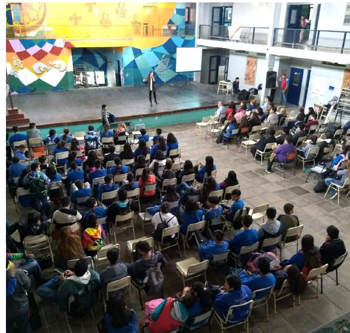
Segunda capacitación de la jornada

En la jornada, que fue declarada de interés por la Cámara de Diputados y el Concejo Deliberante de la Ciudad de La Rioja, se desarrollaron diferentes capacitaciones a cargo de representantes de la Dirección Nacional de Pluralismo e Interculturalidad y de OIM Argentina. La primera capacitación tuvo lugar en el Paseo Cultural Castro Barros y contó con la asistencia de numerosos/as funcionarios/as gubernamentales y de docentes. Mientras que la segunda fue realizada en la Escuela Polivalente de Arte, adonde asistieron más de 300 estudiantes.