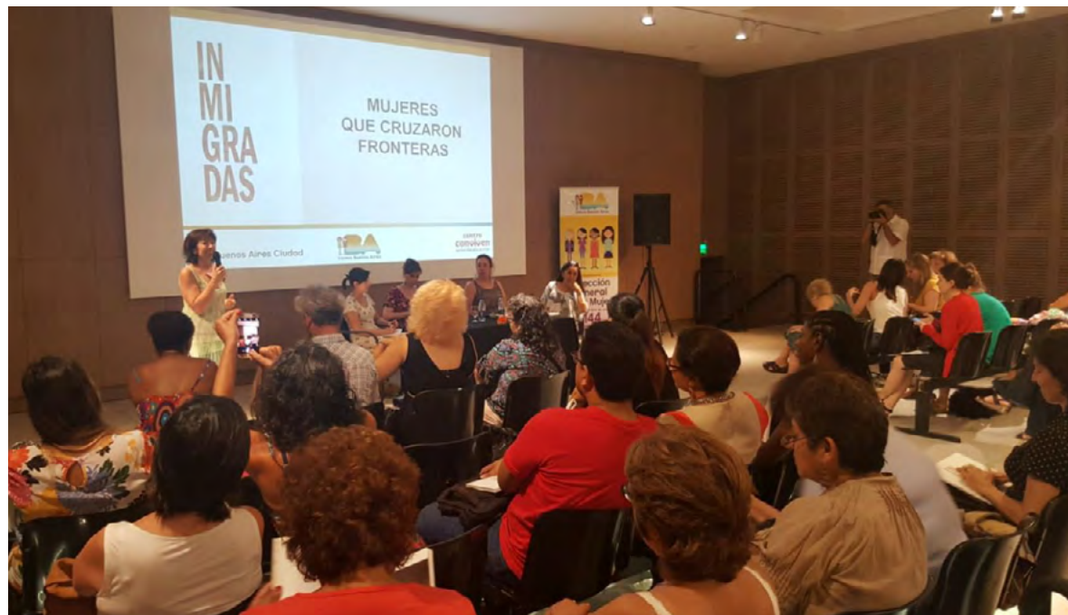
Presentación del libro “Inmigradas. Mujeres que cruzaron fronteras”.

En este marco, representantes de la oficina local de OIM participaron el 12 de enero en la presentación del libro “Inmigradas. Mujeres que cruzaron fronteras”, invitados/as por la Dirección General de la Mujer del Gobierno de la Ciudad Autónoma de Buenos Aires.