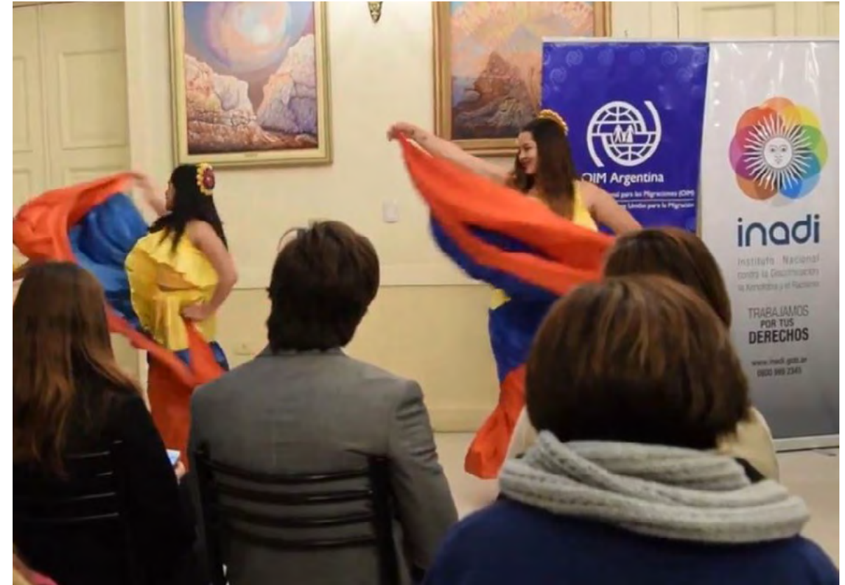
Danzas colombianas durante la presentación en Mendoza