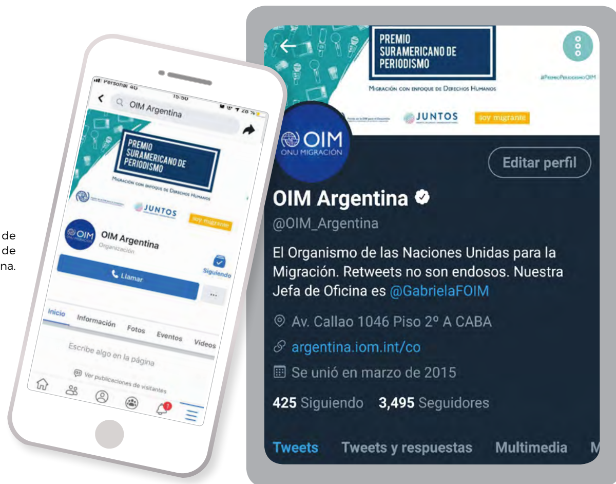
Página de inicio de la cuenta de OIM Argentina en Twitter.