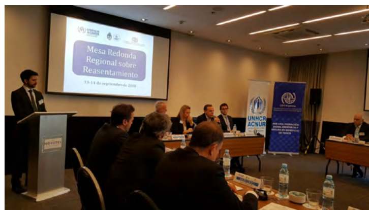
Panel de apertura del encuentro

Posteriormente, en el marco de esta actividad, los/as representantes de los países donantes del ERCM, ACNUR y OIM, visitaron la provincia de Salta, donde se reunieron con los integrantes de la Mesa Técnica Provincial del Programa Siria y visitaron a familias reasentadas en la provincia.