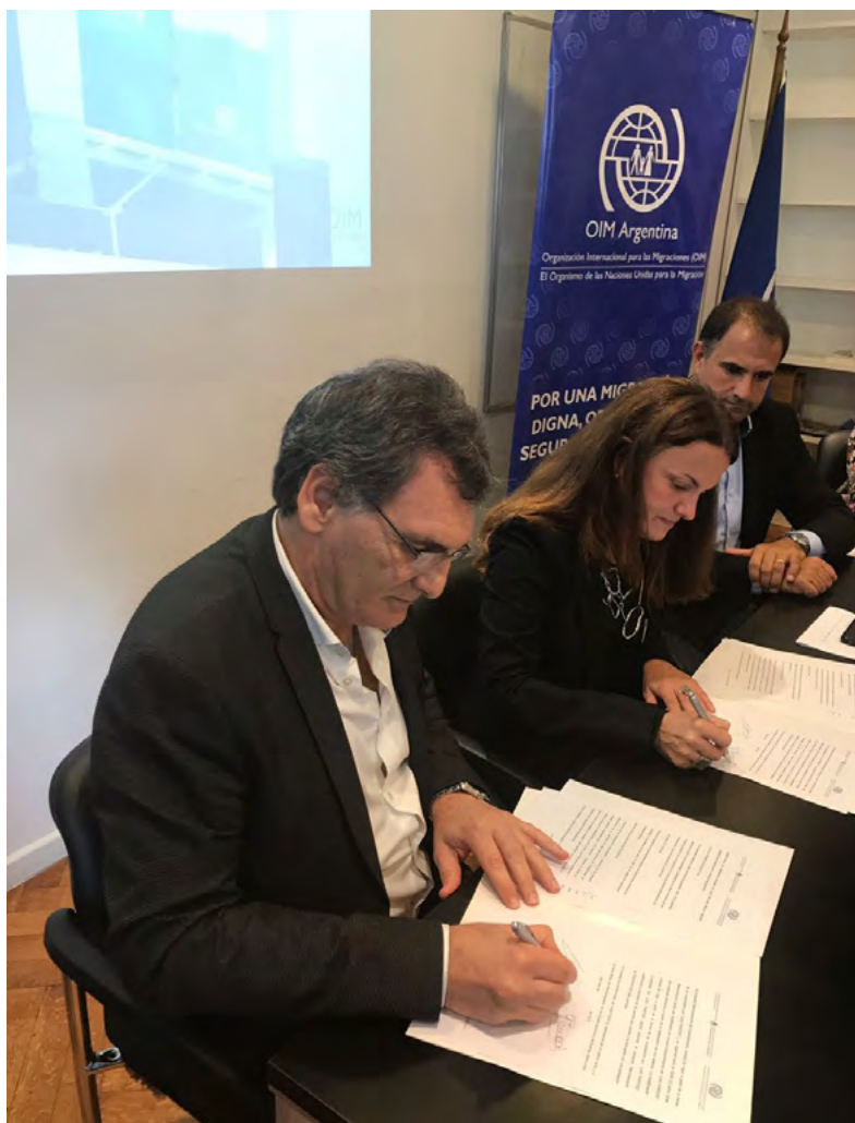
Firma del convenio

Con la firma de este convenio, OIM Argentina ha renovado su compromiso en defensa de los derechos humanos de las personas migrantes y del reconocimiento del pluralismo y la diversidad como valores indispensables de nuestra sociedad.