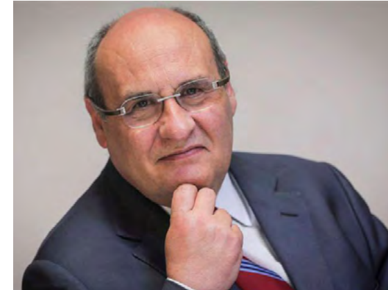
António Manuel de Carvalho Ferreira Vitorino.

El Director General de la OIM, António Vitorino, dio a conocer un mensaje el 18 de diciembre, en ocasión de la conmemoración del Día Internacional del Migrante 2018, en el que sostuvo: