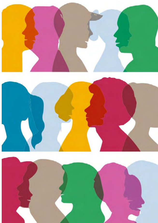
Imagen del curso

El encuentro se constituyó como un espacio de promoción y difusión de los derechos de la población migrante, en el que se compartieron buenas prácticas y experiencias exitosas para su institucionalización, fue declarado de interés por el Honorable Concejo Deliberante de General Pueyrredón.