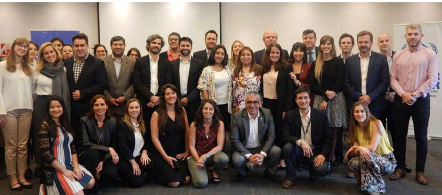
Participantes de la actividad.

la vida de muchas personas. La idea es que este modelo sea sostenible en el tiempo y eficiente en su implementación”.