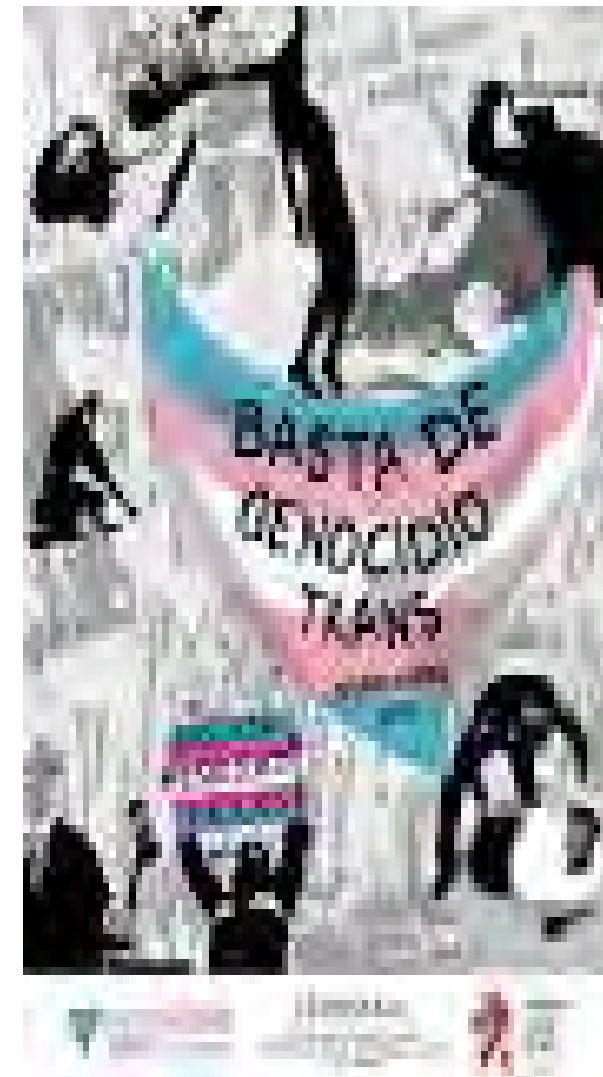
Portada del Informe Regional 2018 del CeDoSTALC.

Gracias a la sistematización de la información obtenida durante el año, se elaboraron 13 informes nacionales y el Informe Regional 2018. Estos documentos resultan una importante herramienta a nivel internacional, ante la evidente falta de conocimiento e información sobre la situación social de la población trans.