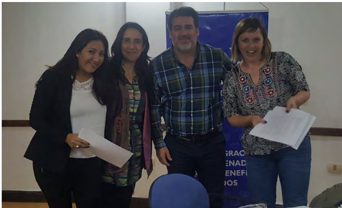
Entrega de certificados.

ACNUR mantiene un acuerdo con la Provincia de San Luis, en el marco del Programa Siria, para la identificación y referencia de personas refugiadas con necesidades de reasentamiento desde el Líbano. Asimismo, OIM presta apoyo organizando el traslado de las familias desde sus lugares de origen y brindando sesiones pre-partida de orientación cultural en las que se les ha informado sobre el Corredor Humanitario, la Provincia de San Luis y sobre Argentina, en temáticas que incluyen educación, salud, búsqueda de trabajo, derechos y obligaciones, y otra información práctica para facilitar la integración. También se han realizado chequeos de salud para asegurar que cada persona está en condiciones físicas de viajar e identificar afecciones médicas que debieran ser tratadas antes o luego de su viaje.