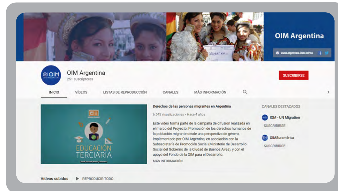
Canal de OIM Argentina en YouTube.