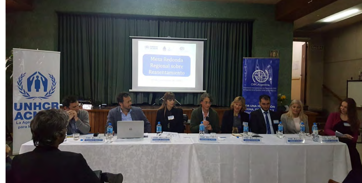
Segundo día de reunión en el Colegio de las Esclavas del Sagrado Corazón de Jesús