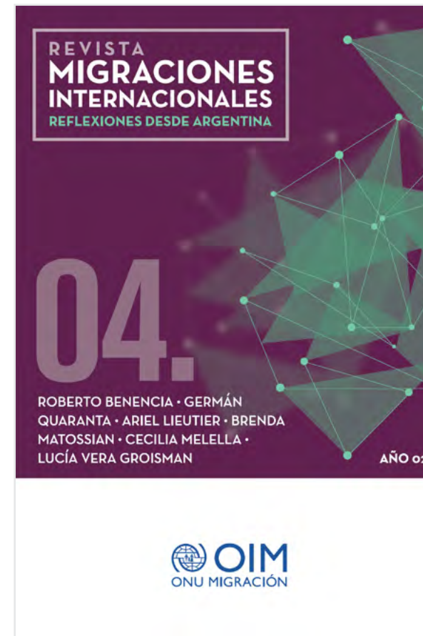
Portada del cuarto número de la Revista "Migraciones internacionales: reflexiones desde Argentina".