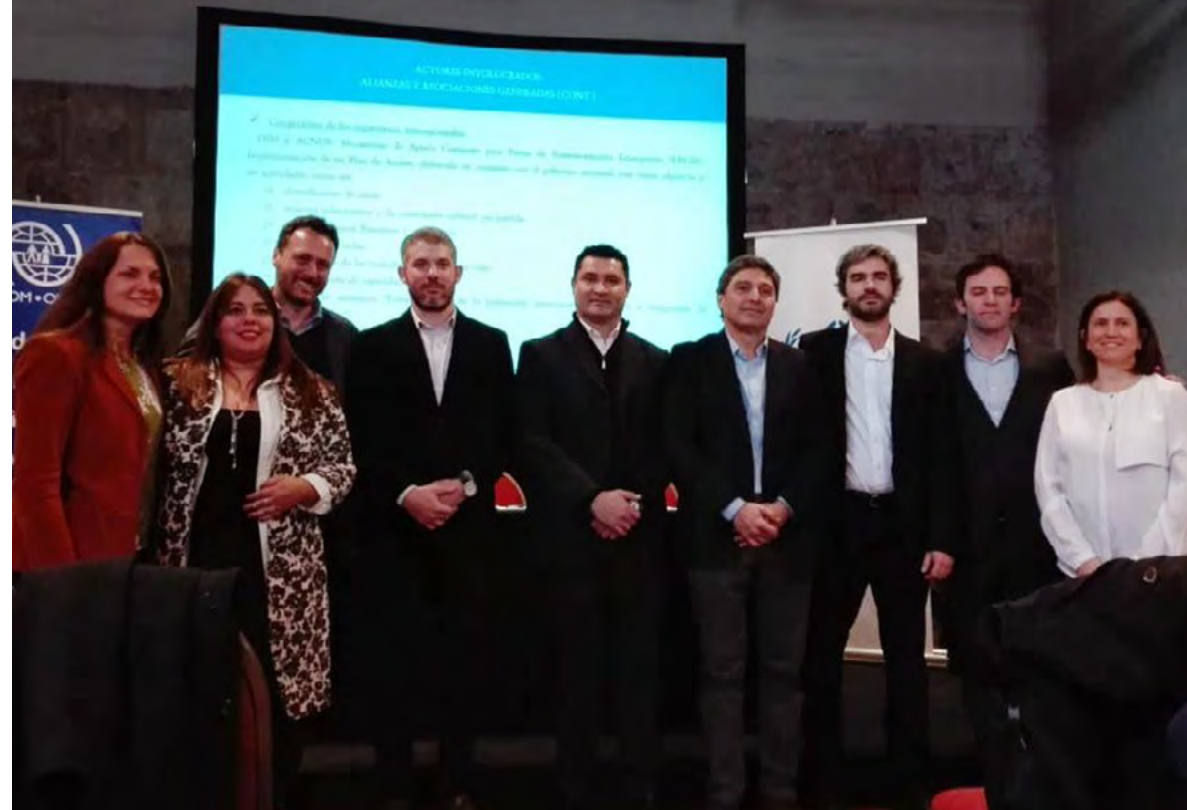
Declaración del Programa Siria "De Interés Provincial".