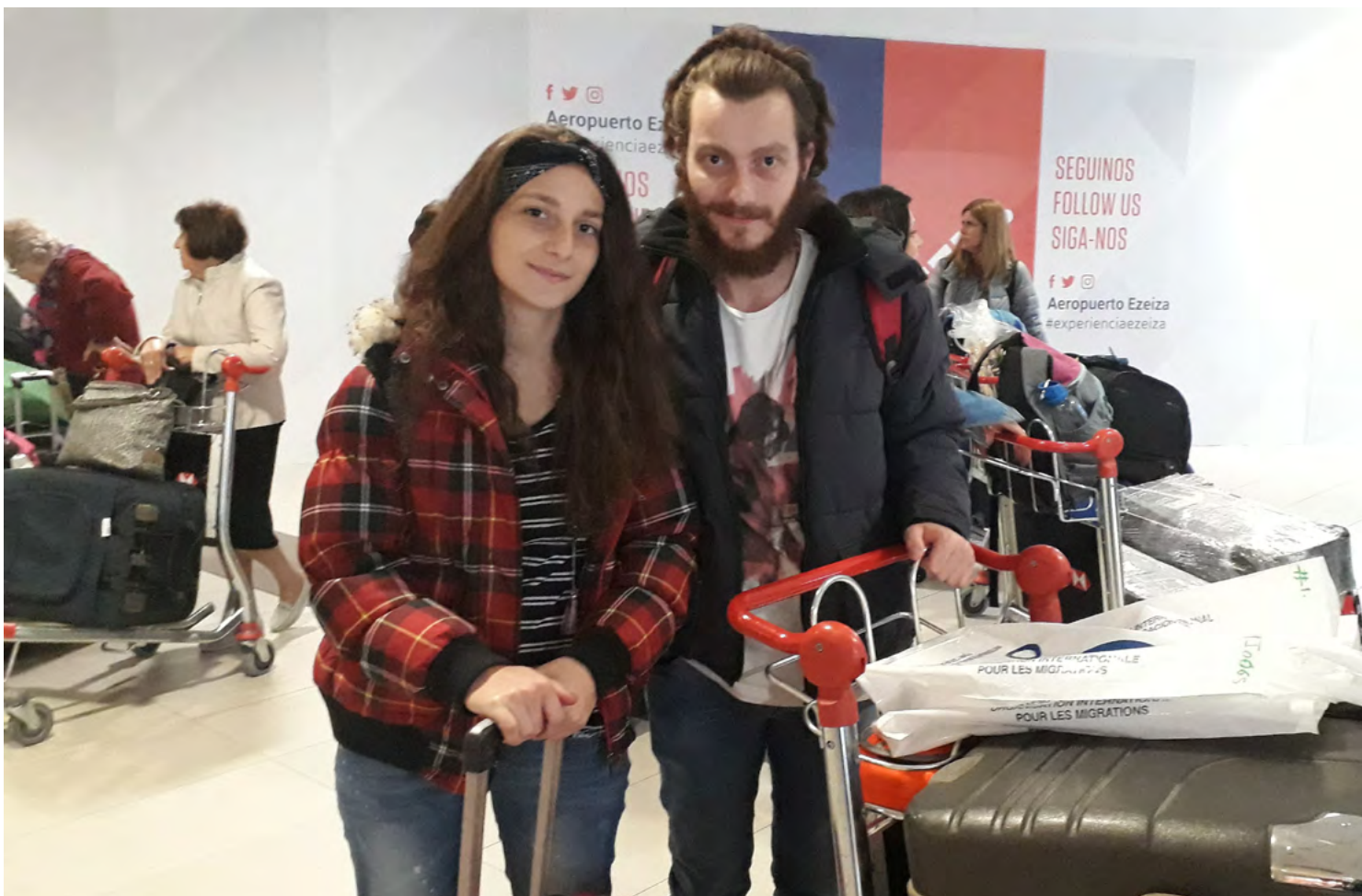
Familia siria arribando a Argentina.