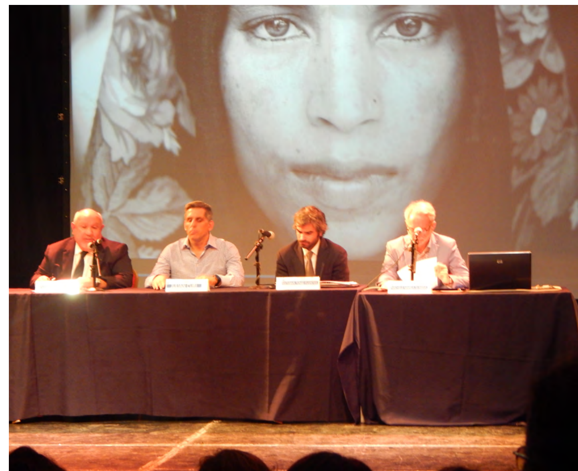
Panel de bienvenida al Encuentro.

El Estado argentino implementa el denominado “Programa Siria” desde 2014. Desde mediados de 2017, ACNUR y OIM apoyan esta política de patrocinio comunitario de