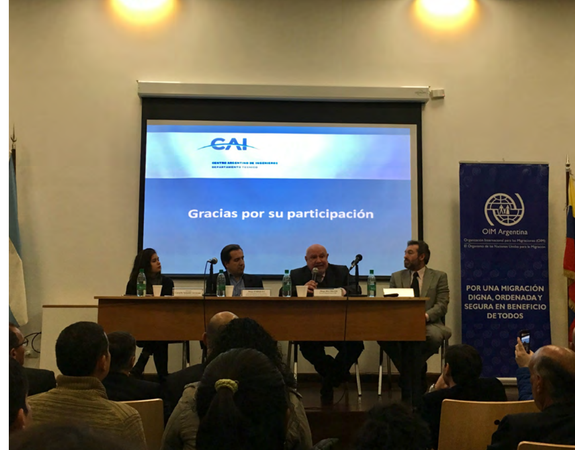
Panel de apertura de la jornada.