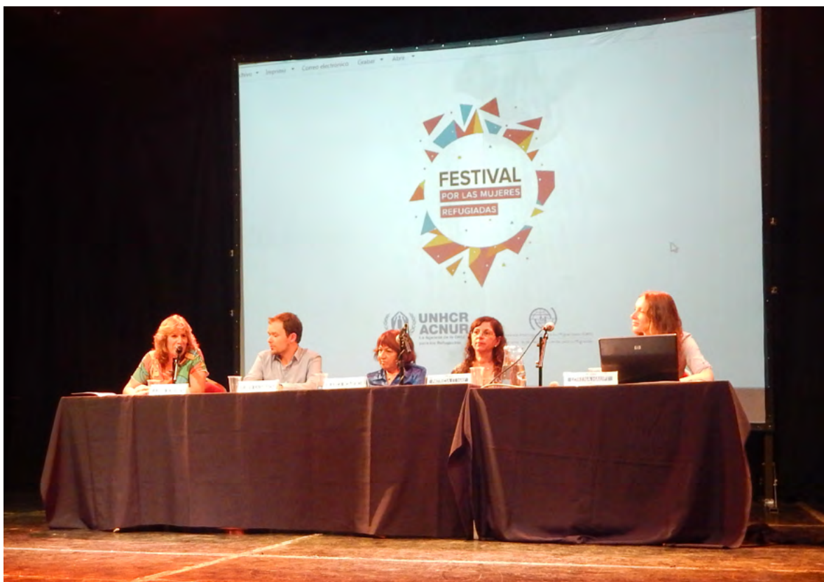
Panel de llamantes.

Las personas “llamantes” u organizaciones “requerentes” de los/as beneficiarios/as sirios/as cumplen un papel fundamental en el proceso de integración, ya que asumen el compromiso de brindar alojamiento y de cubrir los gastos de su manutención por el término inicial de doce meses, acompañando su proceso de integración en la comunidad local. Los/as “llamantes” o “requerentes” pueden ser personas privadas, familias, organizaciones de la sociedad civil, e incluso gobiernos provinciales y/o municipales.