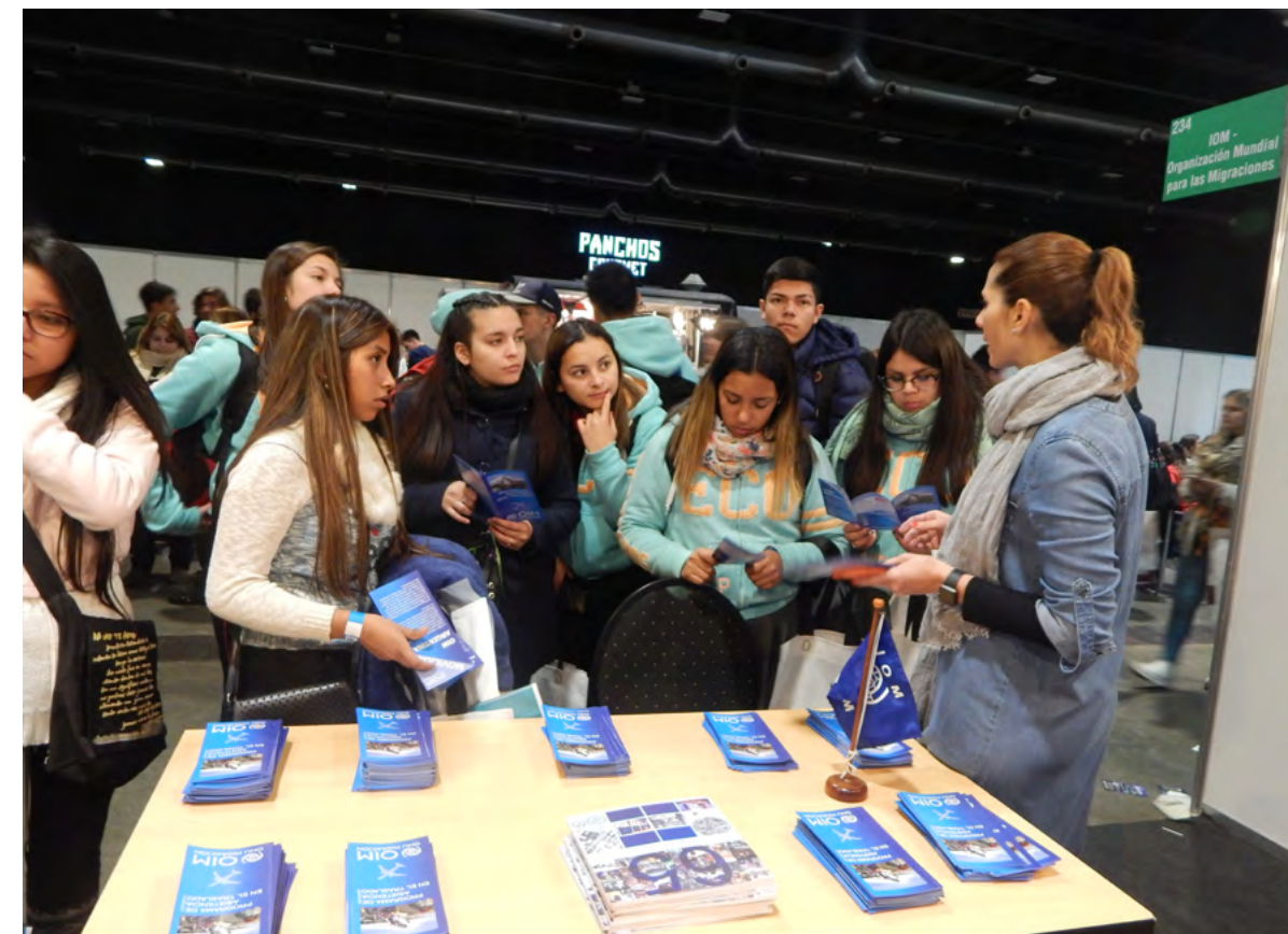
Stand de OIM Argentina en ExpoUniversidad 2018.

Durante el evento, representantes de la oficina local compartieron con los asistentes información sobre el Programa de Asistencia en el Traslado y sobre otras actividades de la OIM.