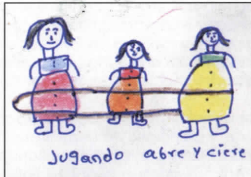
Taller con jóvenes en el Cauca. Archivo Coalición.