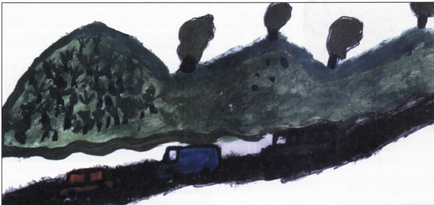
Ilustración, niños del pueblo Indígena Nasa del Cauca.

pérdida de su derecho al nombre. No les permiten espacios de recreación. El hecho de verse expuestos a la violencia. No son considerados como grupo vulnerable, deben ganarse y pelearse la vida...”