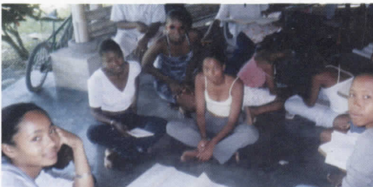
Taller de jóvenes en el Cauca.

Un testimonio presente en el diagnóstico informa: “En primer lugar la prohibición de contacto familiar. Por otro lado, la ausencia de espacios para la educación: no hay programas de capacitación. El otro tema es la