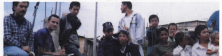
Jóvenes indígenas, afrocolombianos y mestizos, participantes de diversos talleres en el Cauca y Bogotá.

E: Que no quiero ser carne de cañón, que pienso que ahora tienen que tener en cuenta que no todos los jóvenes nos estamos dejando utilizar y muchos jóvenes ya no queremos ser mano de obra para la guerra.