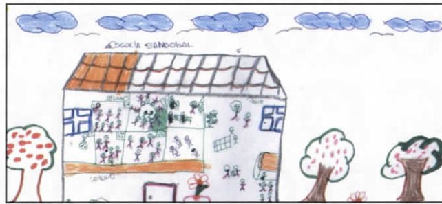
Cartelera de los talleres en el Cauca.

Cómo lograr que las niñas inicien un proceso de auto construcción de un nuevo poder que les posibilite verse y ac-