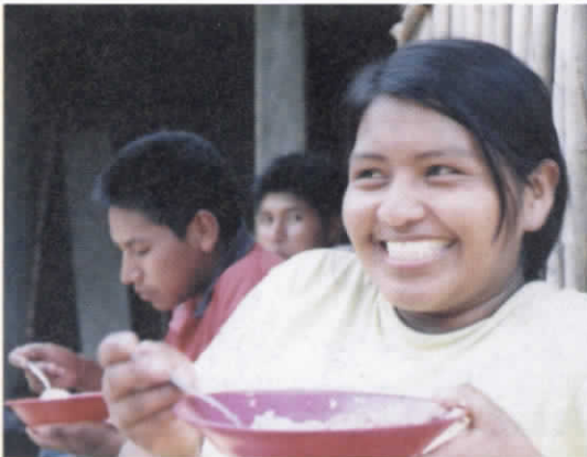
Joven indígena del Cauca.

Bienestar Familiar (ICBF) un 90% de presencia de las FARC y 10% de otros grupos...”