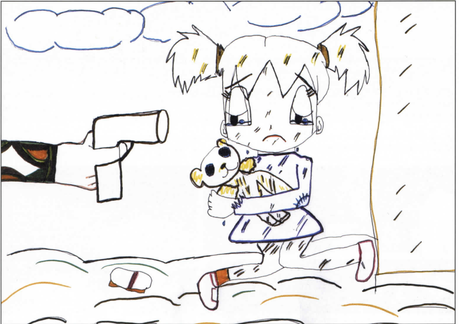
Ilustración de niños participantes de los talleres en el Cauca.

Por lo anterior, en un contexto como el colombiano inunda- do de símbolos de guerra, cuando se favorece que una niña o un niño asuma “así sea por un momento” la identidad en un disfraz, que represente un personaje que resalta símbolos bélicos (soldados, policías, guerrilleros, paramilitares, vaqueros...) no se está ni más ni menos que ayudando a construir los imaginarios que perpetúan el conflicto. Por supuesto tenemos presente las opiniones de aquellos que promulgan que esto tan sólo es un juego, un arma de plástico, un tanque de juguete... es algo inofensivo que no implica mayores consecuencias para la niñez, Pero esto no resulta tan inocente en un lugar en donde la muerte, las armas, la guerra están de forma cotidiana construyendo significados en favor del conflicto.