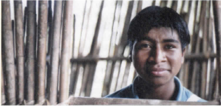
Joven indígena Nasa del Cauca.

El 95% de los niños y las niñas que se han desvinculado y están registrados en los programas del Instituto Colombiano de Bienestar Familiar (ICBF), son de origen rural y provienen principalmente de las zonas más afectadas por el conflicto armado.