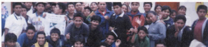
Talleres con jóvenes y ONG's en Cauca y Bogotá.