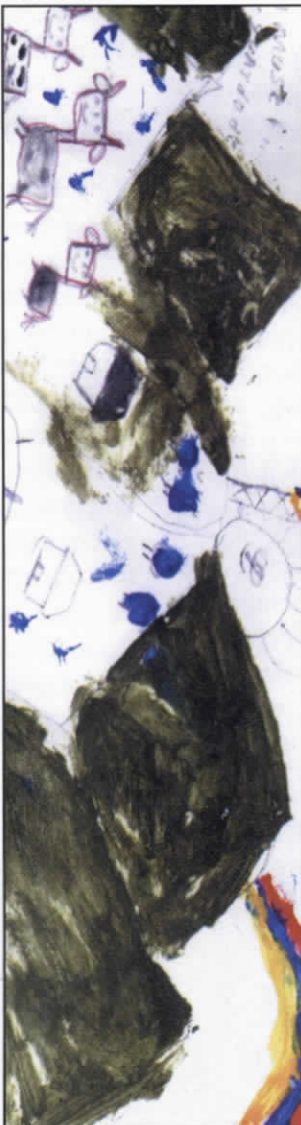
Ilustración, niños del pueblo Indígena Nasa del Cauca.

De los 6.500.000 niños, niñas y jóvenes, un 1.500.000 (de los cuales 591.500 son niñas), viven en la miseria. Los derechos a la vida, al desarrollo, a la protección, la supervivencia y la participación de los niños y niñas son violados en los espacios privados y públicos, siendo evidente la insuficiencia en la definición de políticas, planes y programas sociales 1 para superar los problemas que quebrantan los derechos de la infancia.